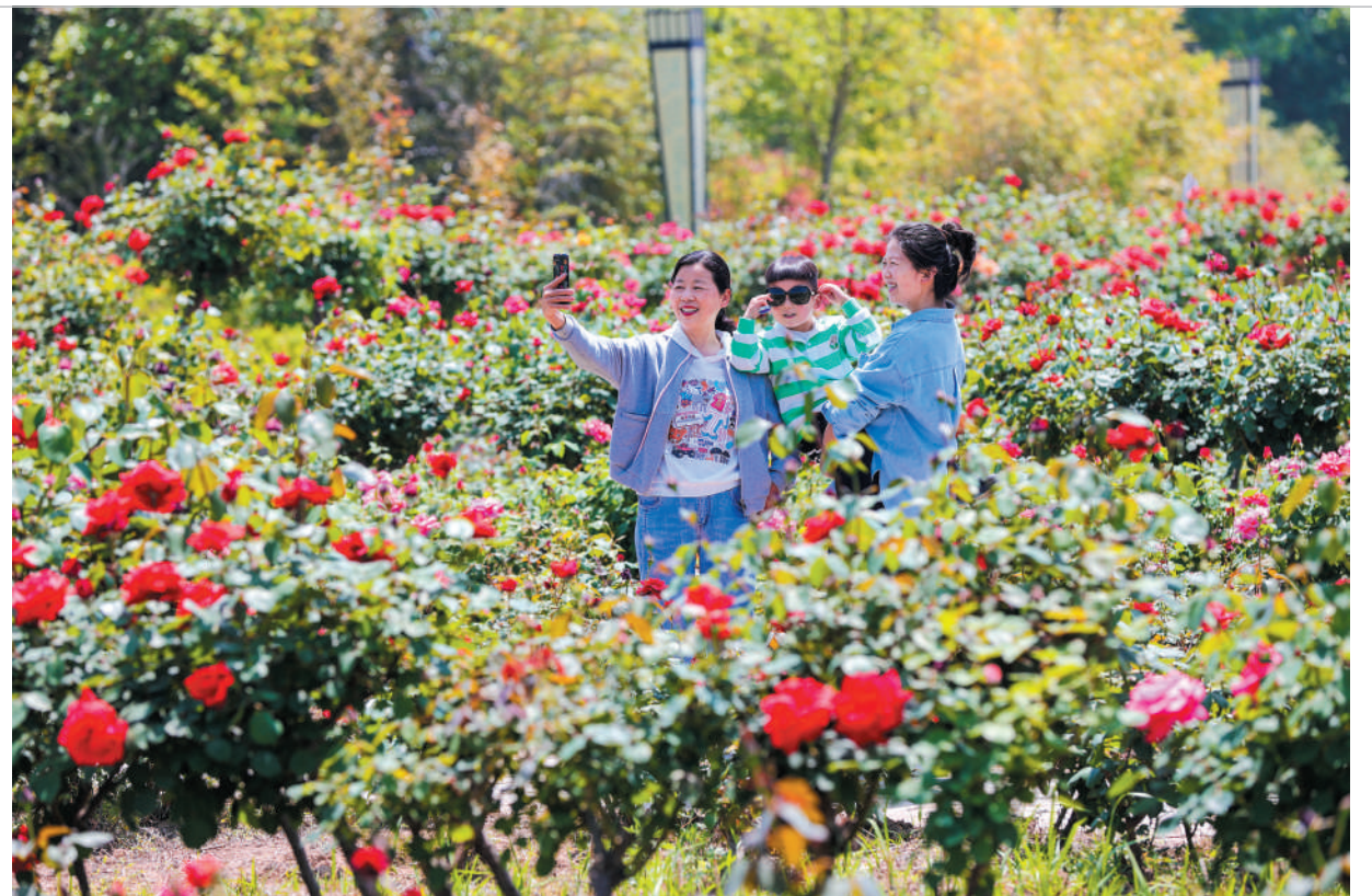
5月6日,游客在南湖湿地公园月季园内拍照留影。目前,南湖湿地公园月季园内的各色月季竞相绽放,吸引了众多游客前来观赏游玩。