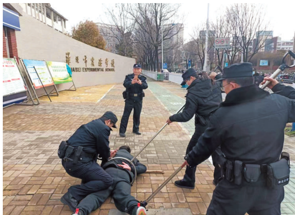
民警、学校保安人员认真进行演练。