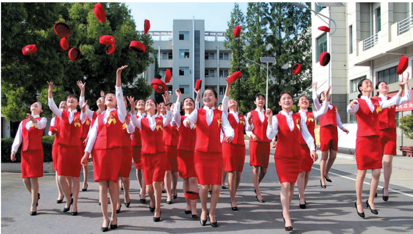
城市轨道交通运营服务专业学生展示风采。