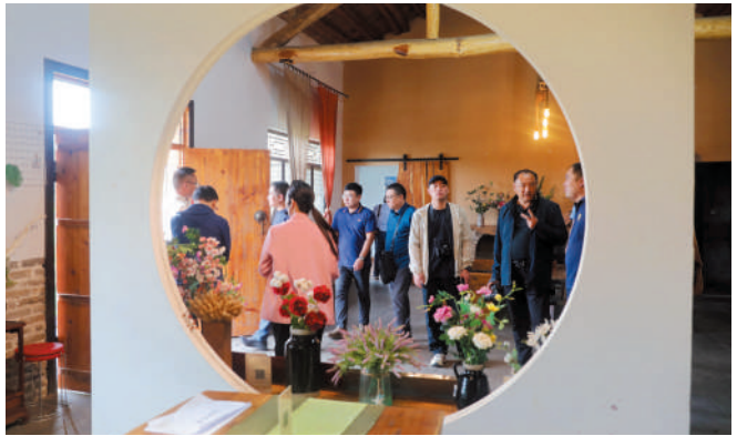
打造特色精品民宿街区——魏寨民宿群一角。