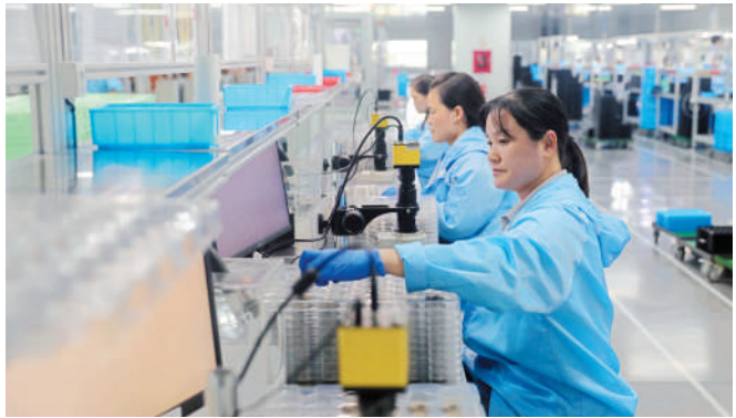
工人在泗县一家电喷系统生产企业车间忙碌。

龙士、李百忍等宿州籍书画大家的艺术作品，让采风团成员驻足流连，充分展示了宿州市丰厚的历史文化底蕴。