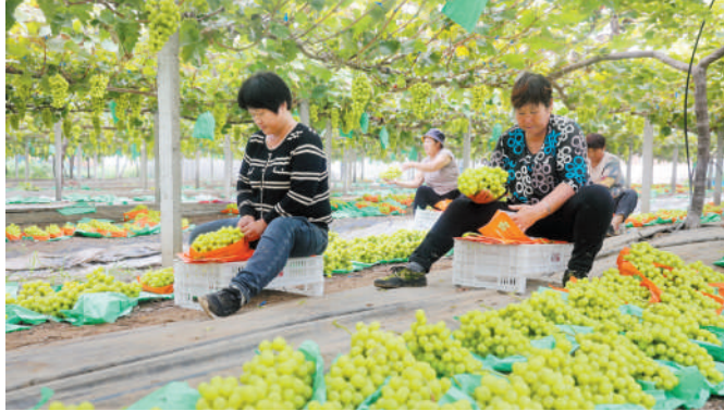
萧县大力发展葡萄产业 助力乡村振兴。