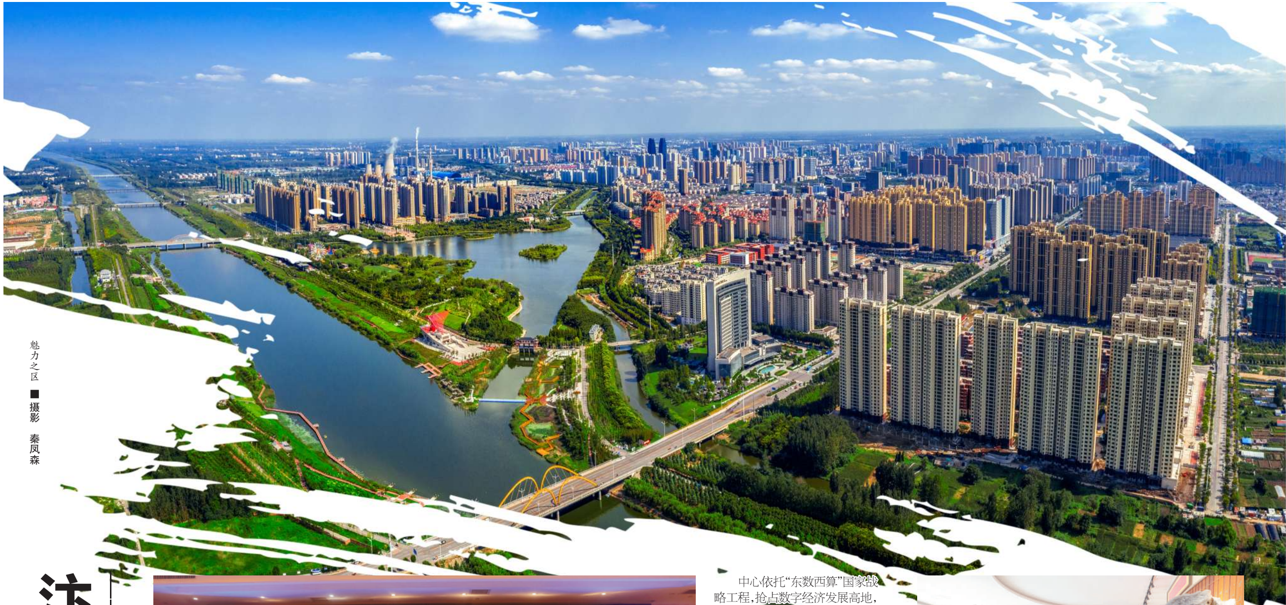
魅力之区