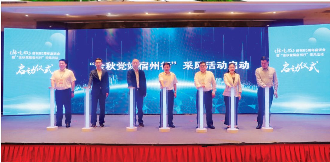
采风活动启动仪式。