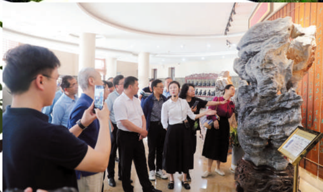
灵璧博物馆里赏奇石。