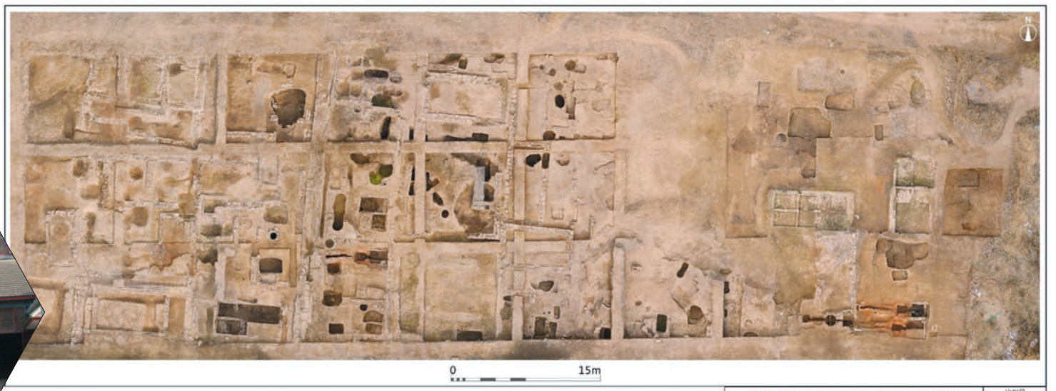
濉溪明清街酿酒作坊群遗址。

民营经济是推进中国式现代化的生力军,在经济社会发展中发挥着重要作用。市委、市政府高度重视,持续优化营商环境,精准施策纾困解难,助推全市民营企业高质量发展。近日,市传媒中心组织全媒体采编团队,深入部分骨干企业采访调研,充分聚焦企业发展现状,引导全市民营企业家坚定发展信心,共促民营经济高质量发展,广泛汇聚加快建设现代化美好淮北的磅礴动能。