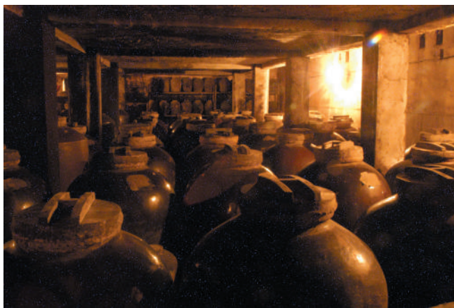
2020年,口子窖窖池群及酿酒作坊入选第四批国家工业遗产名单。

历在目。从那时起,“传承、坚守、创新、发展”八个字已融入一代代口子人对酿酒的炽热热爱中,渗透到酿好酒的如初匠心里。与时代同步,口子酒越陈越香,华丽蝶变为独具特色的美酒文化,城市发展的支柱产业、产业转型升级的增长极、淮北的一张靓丽名片。