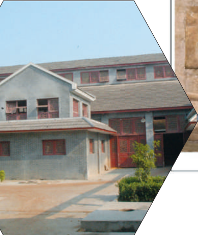
2008年,建于上世纪50年代的口子酒厂建筑群被评定为国务院第三次全国文物普查重要新发现。