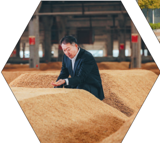
中国酿酒大师徐钦祥。