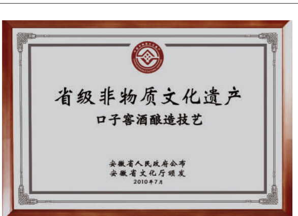
2010年,口子窖酒酿造技艺被评为省级非物质文化遗产。