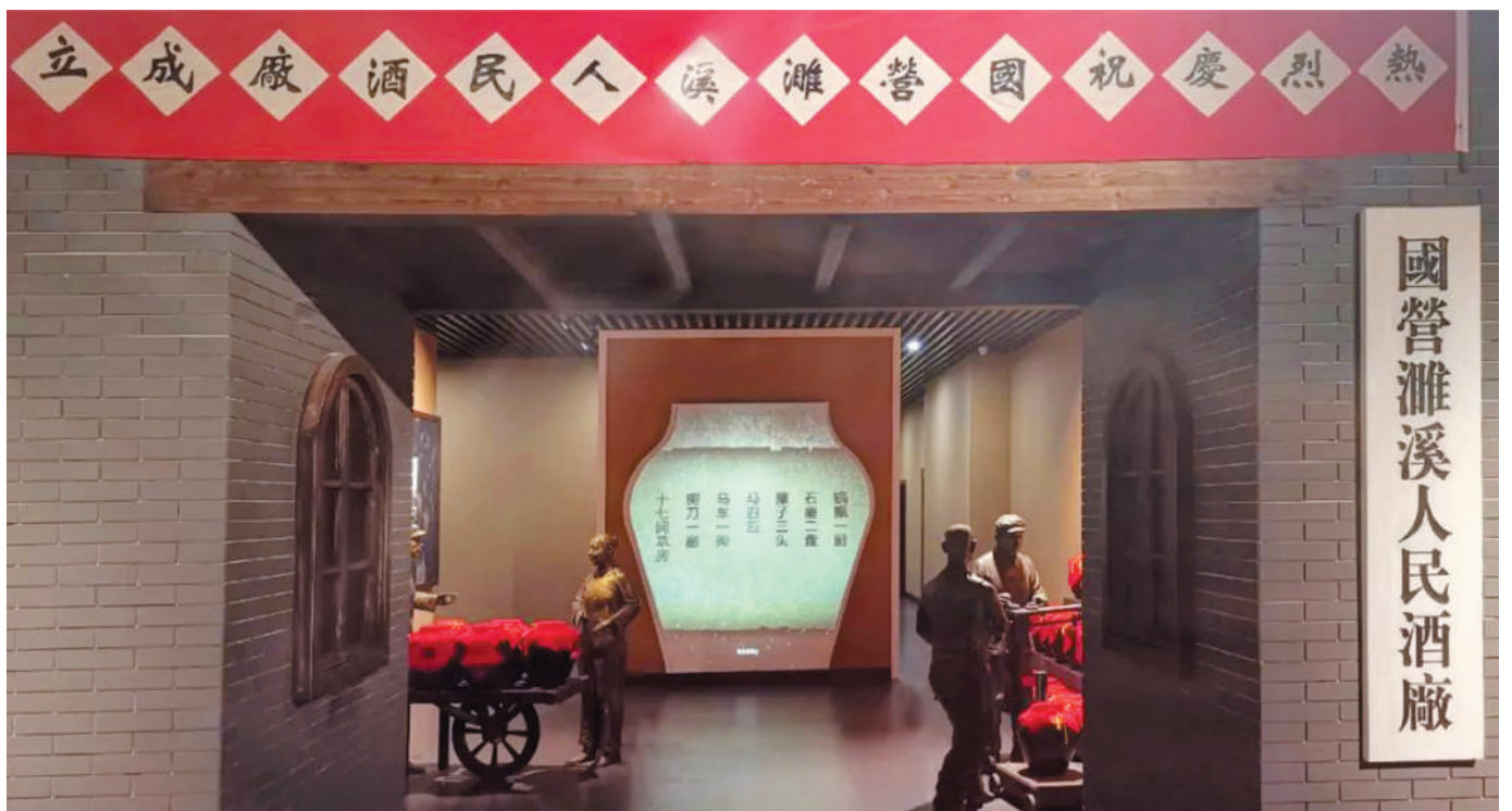
1949年5月18日,国营濉溪人民酒厂成立。

1983年《商标法》正式实施,上世纪90年代计划经济向市场经济转型……各种背景复杂,在省、市两级政府的强力推动下,两家酒厂于1997年合并成立安徽口子集团公司,以适应市场竞争要求和消费