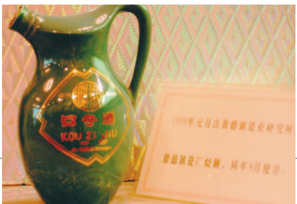
1959年,“濉溪口子酒”作为安徽省重大科技成果,进入国宴用酒序列。