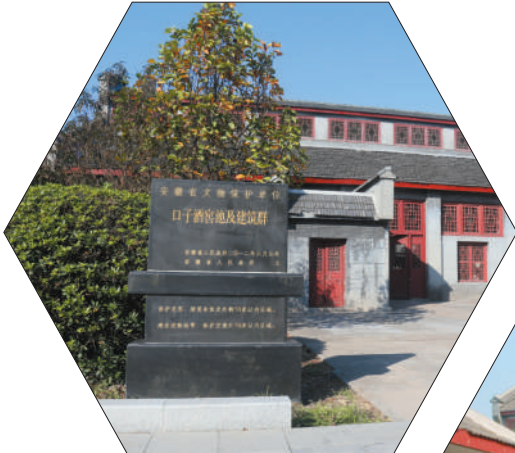
2012年,口子酒窖池及建筑群被评为安徽省文物保护单位。