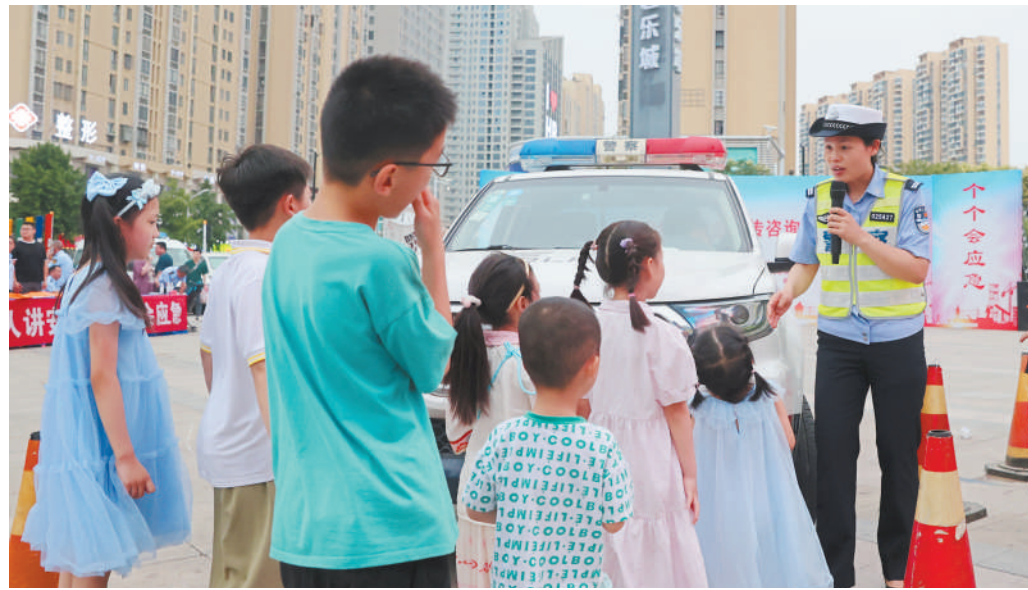
小朋友在活动现场学习汽车盲区安全知识。

此次活动由市委办、相山区政府共同承办，同步推动安全教育进企业、进农村、进社区、进学校、进家庭，积极倡议各级各部门、企事业单位等树牢安全红线意识，压实责任链条，深化安全生产专项整治，防范化解重大安全风险，确保人民群众生命财产安全。动员全市干部群众迅速行动起来，不断提高安全生产意识和应急避险能力，共同筑牢安全生产人民防线，在全社会形成关爱生命、关注安全、推进安全发展的浓厚氛围。