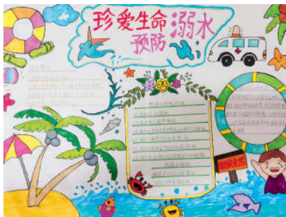
淮海路小学小记者 韩林杉 指导老师:张萍