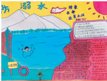
淮海路小学小记者 谢瑞馨 指导老师:解春荣