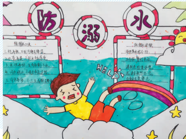
淮海路小学小记者 时俊贤 指导老师:郭魁寿