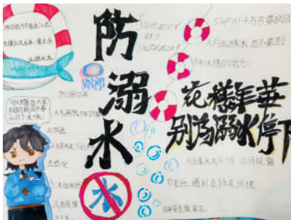
淮海路小学小记者 许乐瑶 指导老师:王艳艳