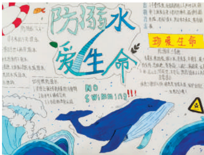
淮海路小学小记者 马佳慧 指导老师:陈伟敏