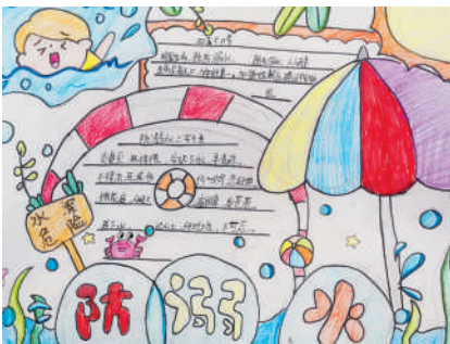
淮海路小学小记者 尹海瑶 指导老师:陈伟敏