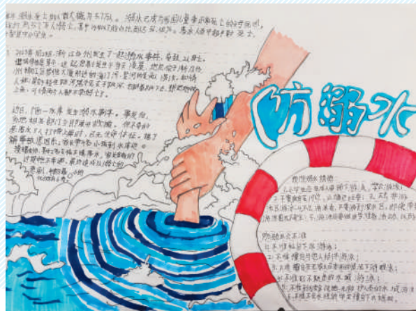
淮海路小学小记者 邵智瀚 指导老师:孙玉梅