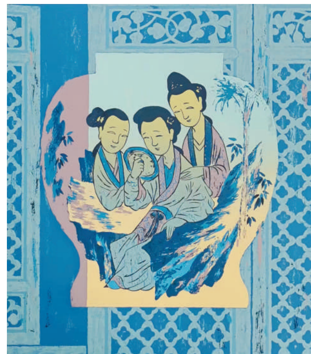
古徽州韵青花系列之一(版画)