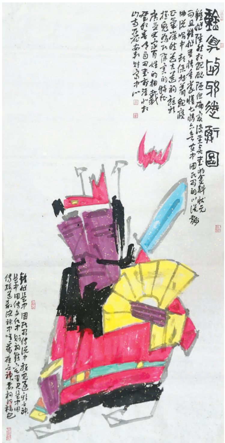
钟旭驱邪送福图(国画)