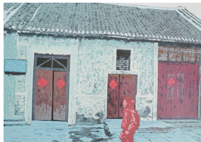
走进老街·大红门系列3(版画)