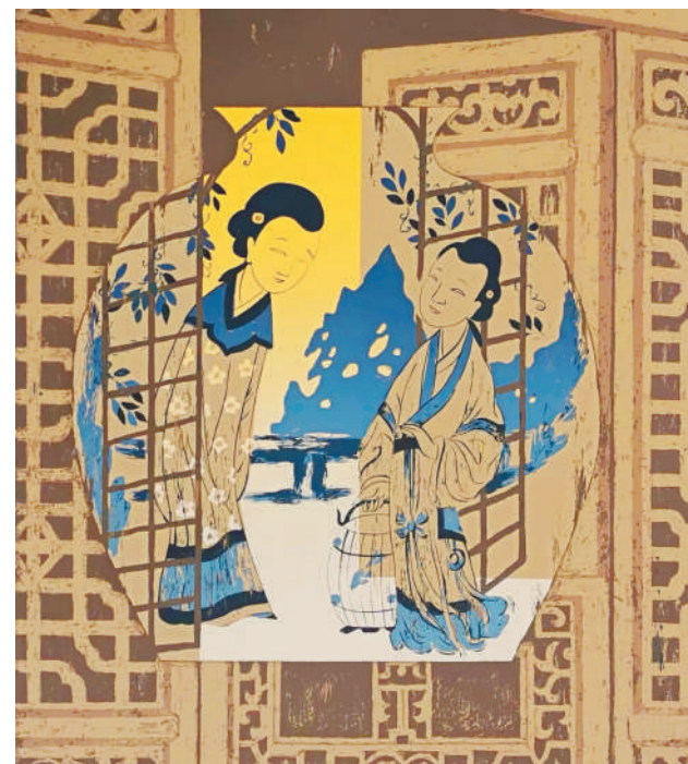
古徽州韵青花系列之二(版画)