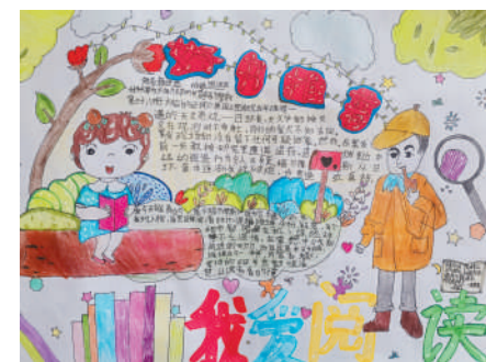
淮海路小学小记者 杨伊然 指导老师:金晓燕