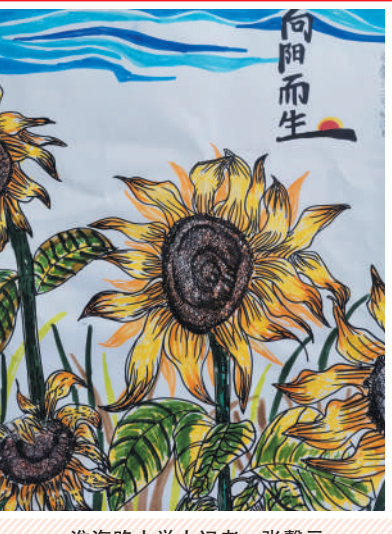
淮海路小学小记者 张馨元 指导老师: 黄金妹