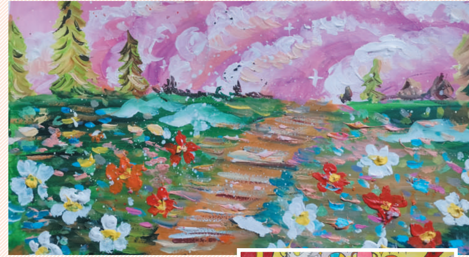
指导老师: 代素梅 淮海路小学小记者 周馨妍