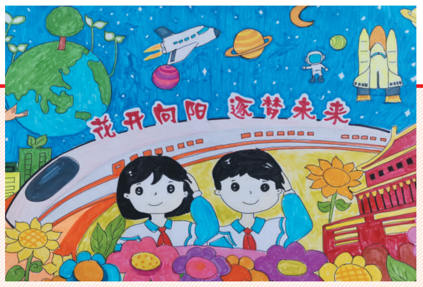
淮海路小学小记者 叶雨阳 指导老师: 张敏