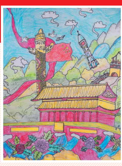
淮海路小学小记者 任红锟 指导老师:李洁文