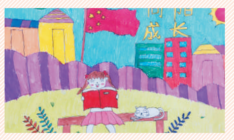
淮海路小学小记者 张艾嘉 指导老师:李洁文