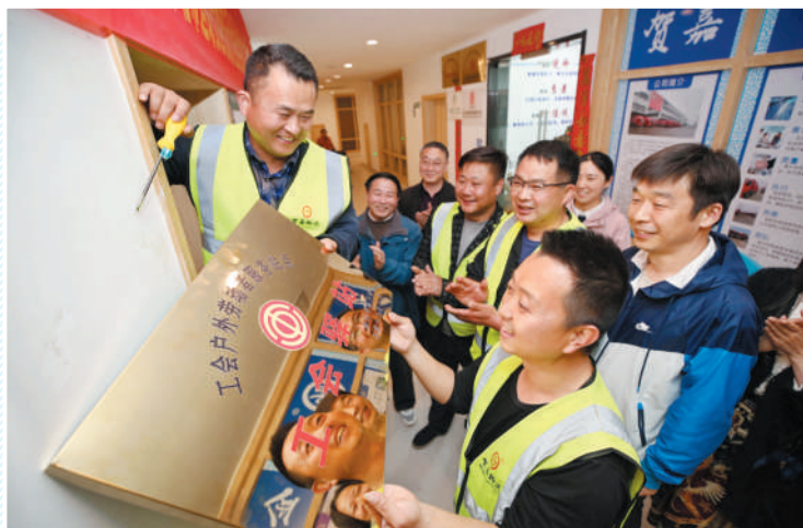
悬挂“工会驿站”匾牌。