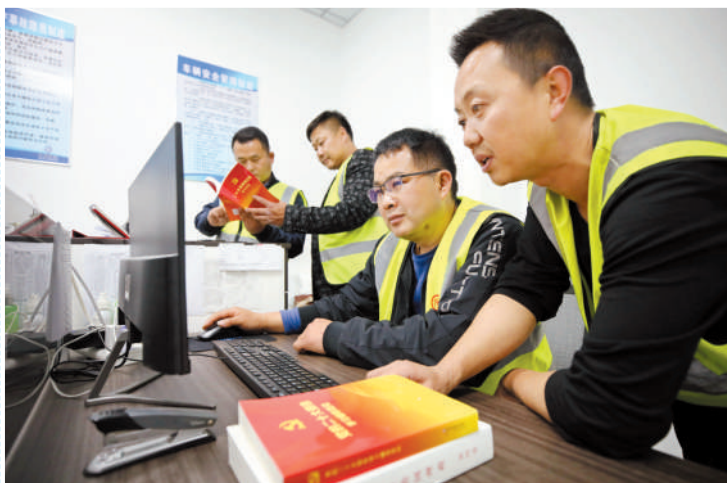
淮北籍货车司机在工会驿站内学习充电。