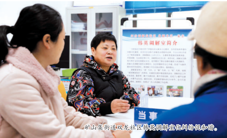
矿山集街道双龙社区韩英调解室化纠纷促和谐。