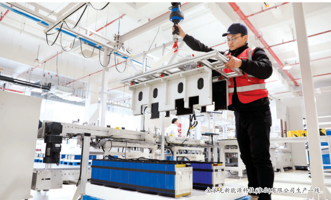
金派克新能源科技(淮北)有限公司生产一线。