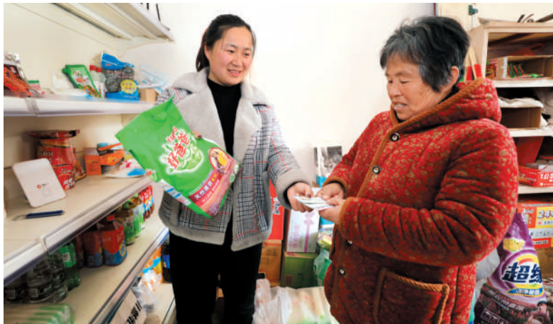
村民在段庄村积分超市兑换生活物品。

小积分兑出在乡村大文明,此举大大促进了村居环境改善,提升了村容村貌,乡风文明蔚然成风。为让发展红利更多惠及民生,段庄村还为全村近400名60岁以上老人缴纳医疗保险,让村民切实感受到看得见、摸得着的幸福感和获得感。