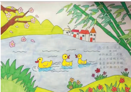
淮海路小学小记者 梁成城 指导老师:张萍