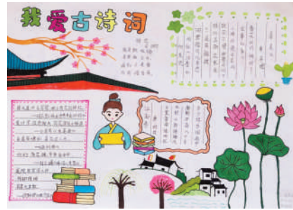
淮海路小学小记者 韩林彬 指导老师:张萍