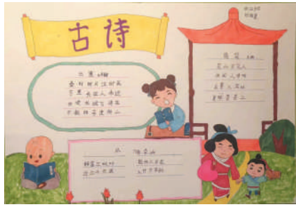
淮海路小学小记者 刘陆晨 指导老师:郭魁寿