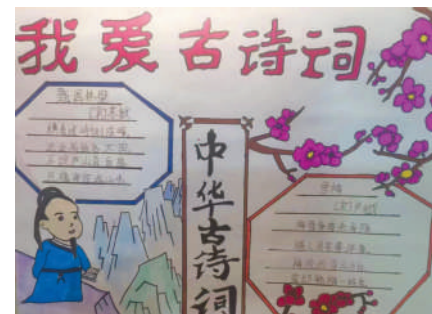
淮海路小学小记者 刘晗玥 指导老师:张萍