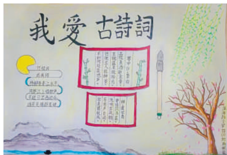
淮海路小学小记者 冉彬辰 指导老师:李森