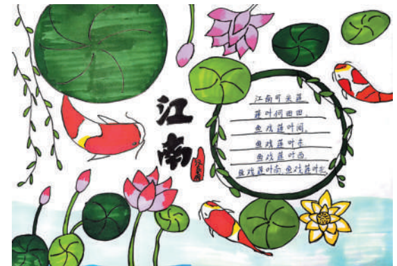
淮海路小学小记者 赵宸翊 指导老师:金晓燕