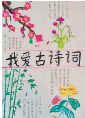
淮海路小学小记者 于若妍 指导老师:金晓燕