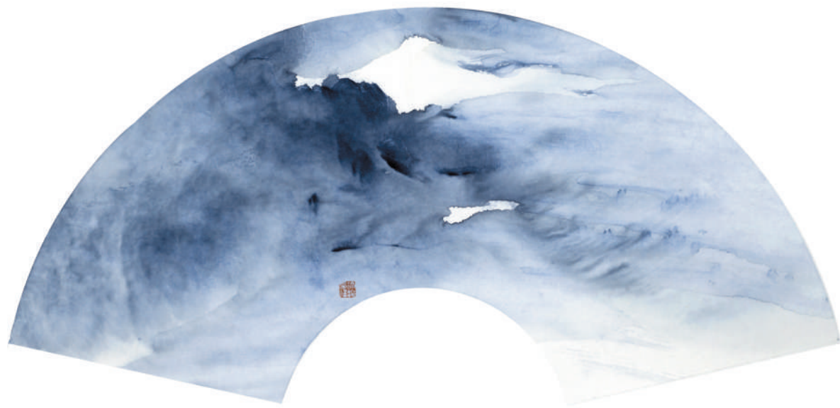
水韵青花扇面之七

1962年10月生于安徽淮北,1981年毕业于淮北师范学校美术班(现淮北职业技术学院),1986年毕业于阜阳师范学院美术系,1987至1992年就职于原淮北矿务局,1994年毕业于北京画院高研班,曾任职于《中国书画》杂志社、北京当代书画研究会、中国新水墨画院等,现为华北科技学院名誉教授、国家一级美术师、独立艺术家。2015年5月在北京798艺术区举办“水韵青花——许振水墨作品展”,2016年获“中韩文化交流大使”称号,2019年“水韵青花作品”获国际书画世界行(土耳其站)“金玉兰奖”。