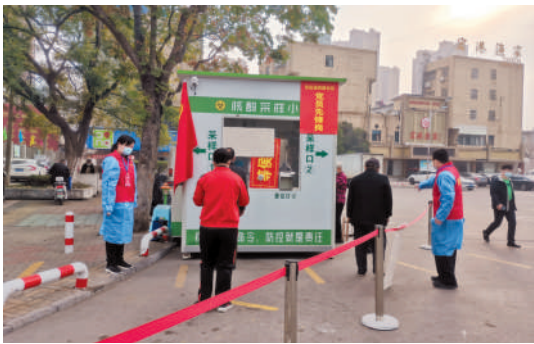
党员志愿者在核酸检测点维持秩序

今年以来,在相山区委、区政府的坚强领导下,东街道全力以赴攻坚克难,统筹推进疫情防控和经济社会发展,各项工作接连取得新突破,努力为全区经济社会高质量发展持续贡献东街道力量。 始终坚持以人民为中心,全面落实“外防输入、内防反弹”策略。东街道持续加强常态化疫情防控工作的组织领导和统筹协调,完善工作机制和应急预案,不断巩固向好态势,不麻痹、不厌战做好重点人群排查和健康管理、疫情防控相关工作。继续深化社区网格化管理,实行网格员包保责任,切实为疫情防控构筑起有效的免疫屏障。积极做好核酸检测工作,做好重点场所核酸筛查,确保群众健康安全。