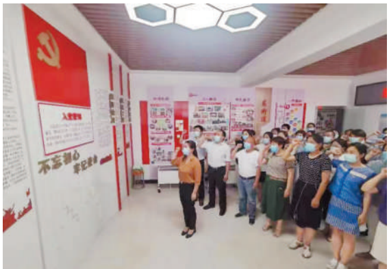
七一重温入党誓词