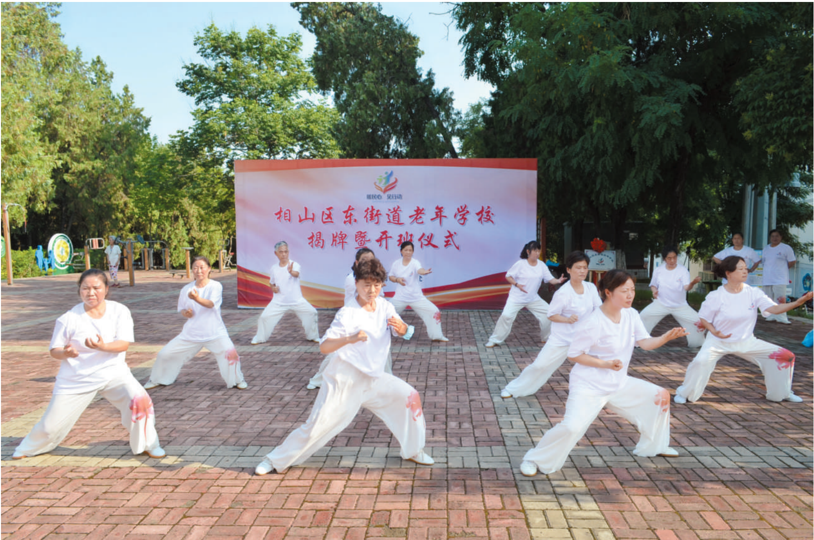
东街道老年学校太极拳课程展示

社会事业统筹发展,文明创建成果丰硕。东街道加快推进市域社会治理现代化进程,以“社会矛盾化解、社会管理创新”两项重点工作为着力点,以“发挥特色、突出亮点、争创先进”为目标,积极主动地围绕中心服务大局,强基固本,创新宣传载体,统筹推进社戒社康、反邪教、反电信诈骗、防范养老诈骗等工作,努力建设更高水平的平安东街道办。针对长山路两侧房屋居住环境差、铁路涵洞出行不便等问题,结合实际对两侧房屋设计主题文化墙,组织对周边小菜园、堆积杂物开展集中清理,安装居民休闲椅,更换破损锈蚀电表箱,进一步提升长山小区周边基础设施环境。打造“幸福里”特色诗歌巷,吸引广大居民朋友打卡拍照,在提升环境卫生的同时又提升辖区居民的幸福感和获得感。开展空中管线、私搭乱建整治行动,及时发现、及时整治。充分发挥志愿者作用,深入大街小巷、社区小区积极开展文明劝导、疫情防控宣传、帮扶居民等志愿服务活动。全力以赴解决群众最紧要的大事、最关切的小事、最普惠的实事和最期待的好事,努力让市民群众更有盼头,更有甜头。