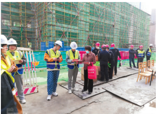
安全生产知识宣传进工地