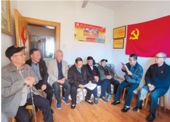
学习党的二十大精神