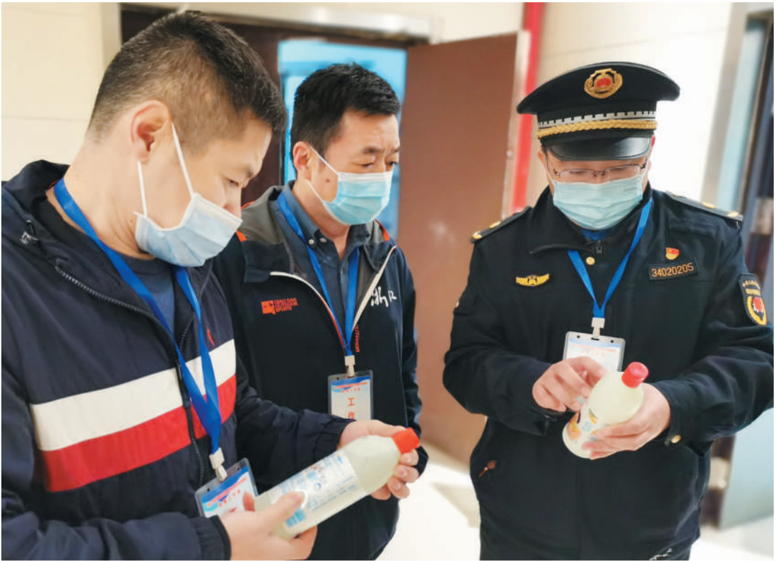
督查组人员对消毒物品有效期等进行查验。