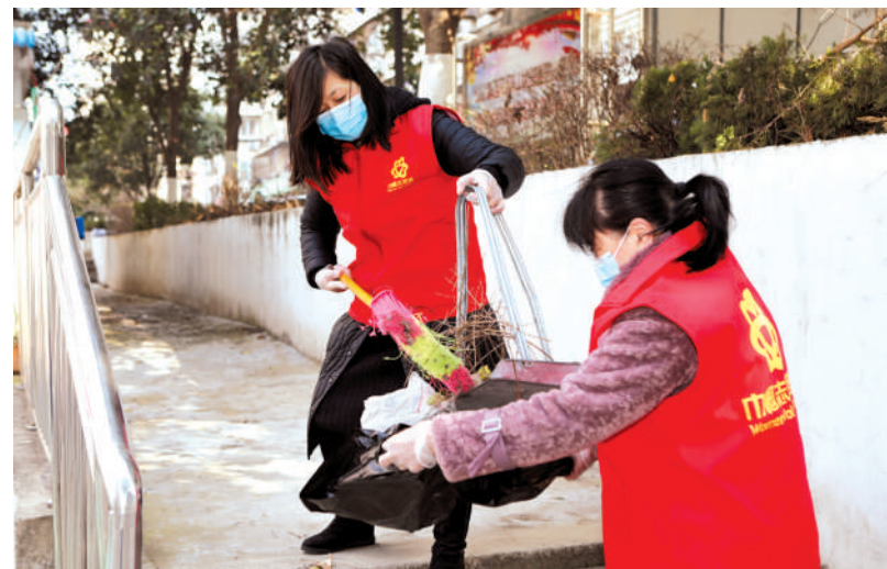
巾帼志愿者清扫街巷卫生。