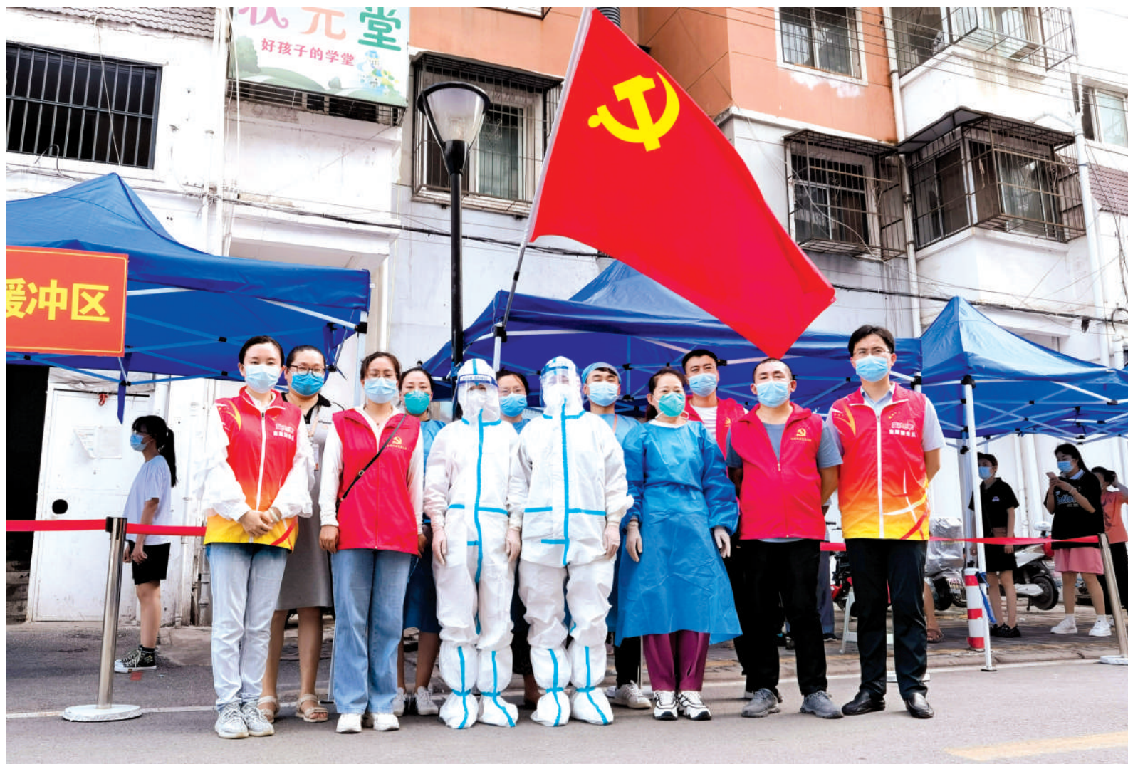
相南街道西城社区志愿者坚守战“疫”一线。