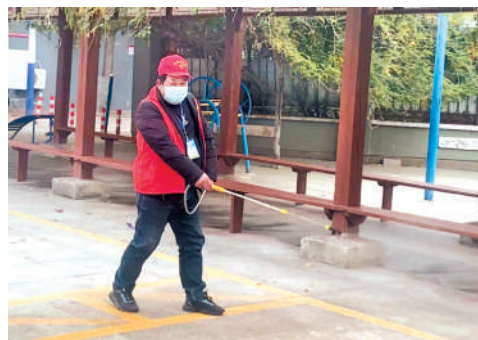
任圩街道代庄社区志愿者对居住环境定时消杀。