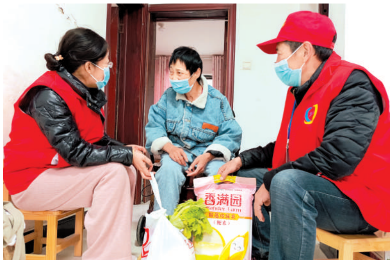
为居家隔离人员运送物资。