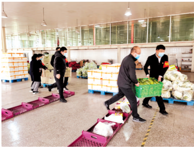
相山经济开发区志愿者为企业上门服务,搬运物资。