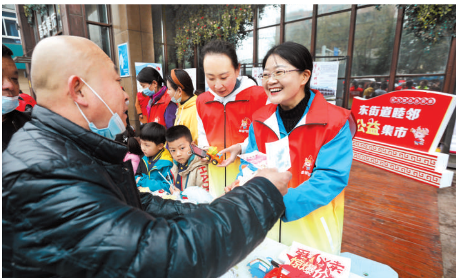
东街道供电社区开展睦邻公益集市活动(资料图片)。

微光可成炬,大爱映相城。如今,漫步相山区街头巷尾,筑牢防疫屏障,交通秩序维护,宣讲崇德向善……总能看到身穿红色马甲的志愿者,尽己所能弘扬志愿精神,更加精准化、精细化开展志愿服务,在提升基层治理的社会化水平,促进市民群众思想觉悟、道德水准、文明素养和社会文明程度不断提升等方面,持续发挥着不可替代的作用。