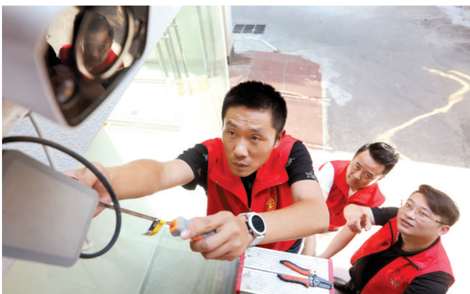
志愿者为居民提供上门维修服务(资料图片)。