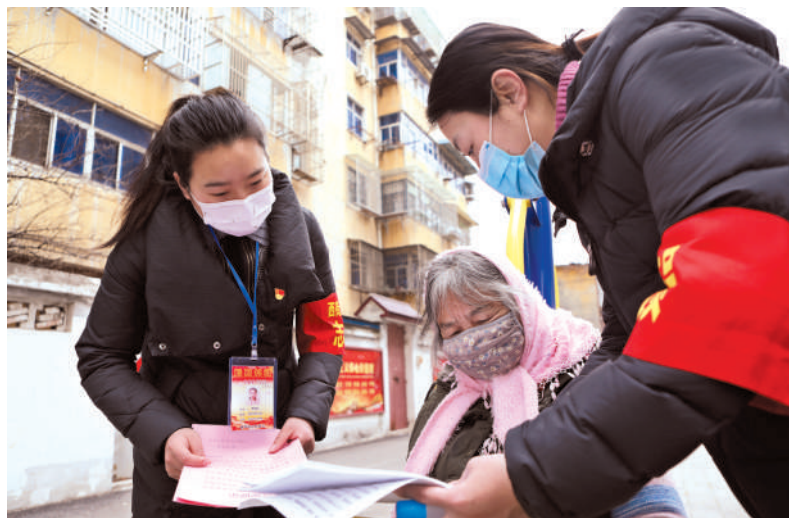
防疫有担当,青年志愿者在行动。