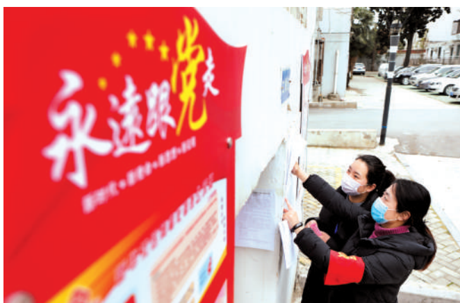
防疫有担当,青年志愿者在行动。