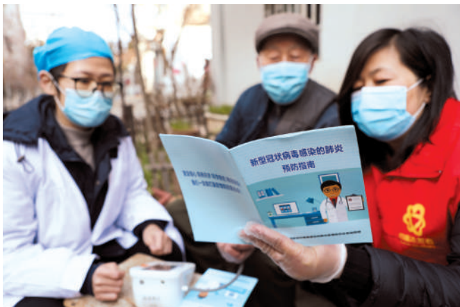
巾帼志愿者宣传防疫知识。