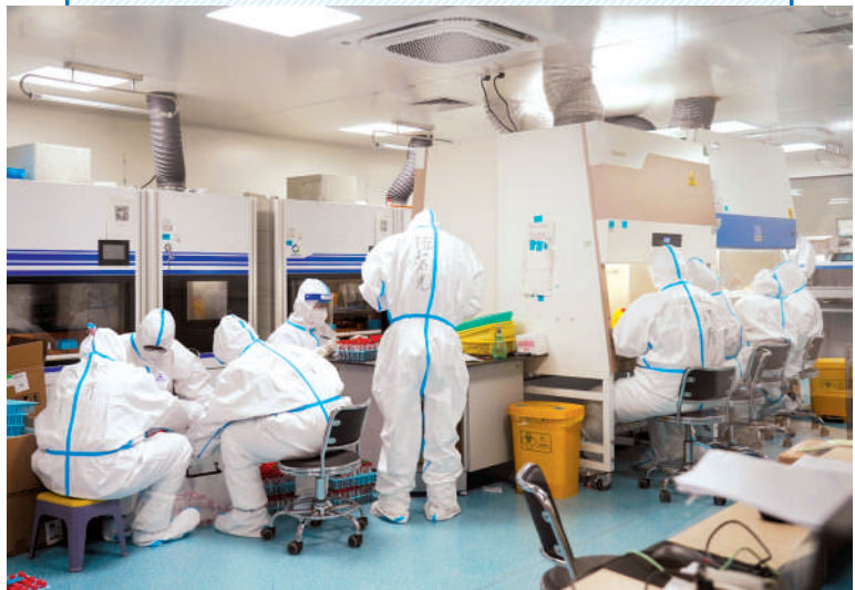
一份份核酸检测报告的背后，是检测团队的艰辛付出。