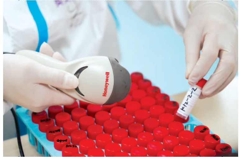
严格规范核酸检测流程。