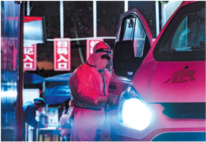
每辆急救车统一配备司机、医生、护士。