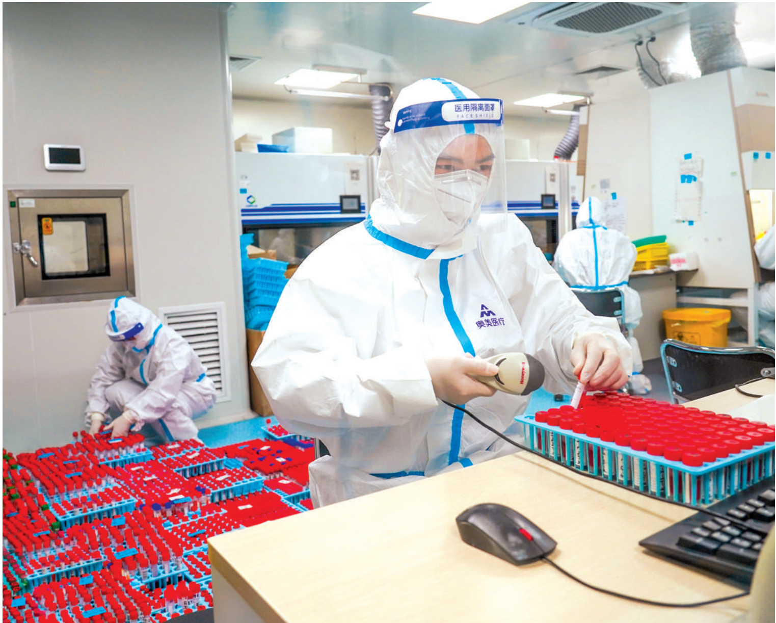
核酸检测实验室24小时运转。