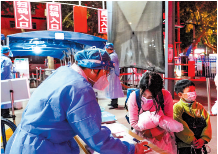
筑牢医院入口三道安全防线。