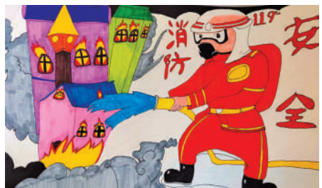
淮海路小学小记者 梁成城 指导老师:张萍