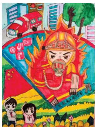
淮海路小学小记者 于若妍 指导老师:金晓燕