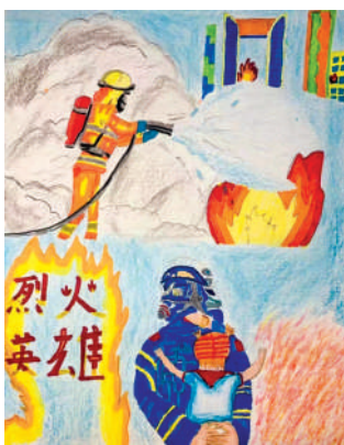
淮海路小学小记者 冉彬辰 指导老师:李森