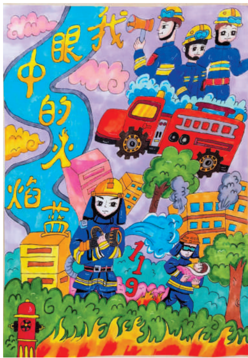
淮海路小学小记者 吴嘉怡 指导老师:金晓燕