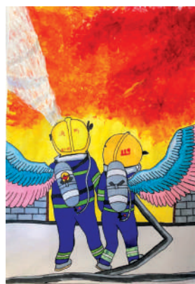
淮海路小学小记者 李岩 指导老师:孙玉梅