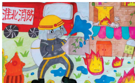
淮海路小学小记者 韩林杉 指导老师:张萍