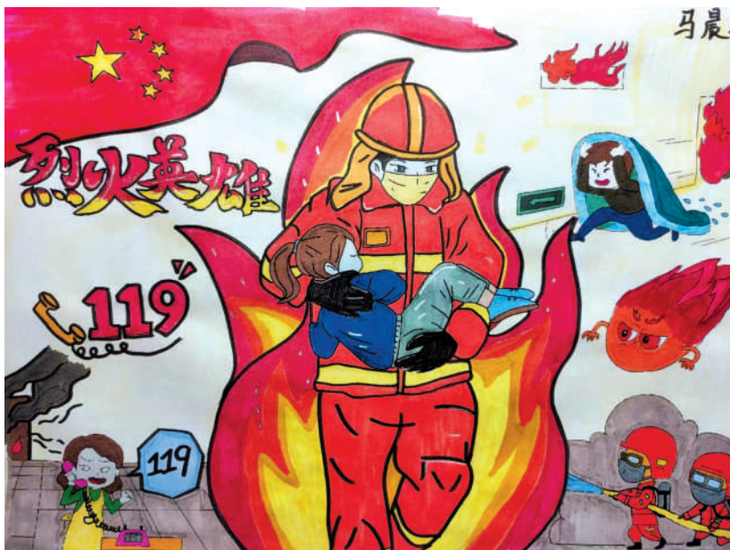
淮海路小学小记者 马晨曦 指导老师:郭魁寿