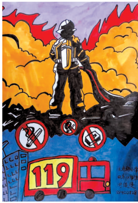
淮海路小学小记者 时俊贤 指导老师:郭魁寿

周刊讯 全国消防安全日来临之际,为进一步加强小学生对突发事件的灵活应变能力,掌握消防安全知识,培养消防安全意识,近日,淮海路小学小记者站开展“手绘消防梦 安全驻心间”消防日主题绘画活动。希望所有的小记者都能够通过此次活