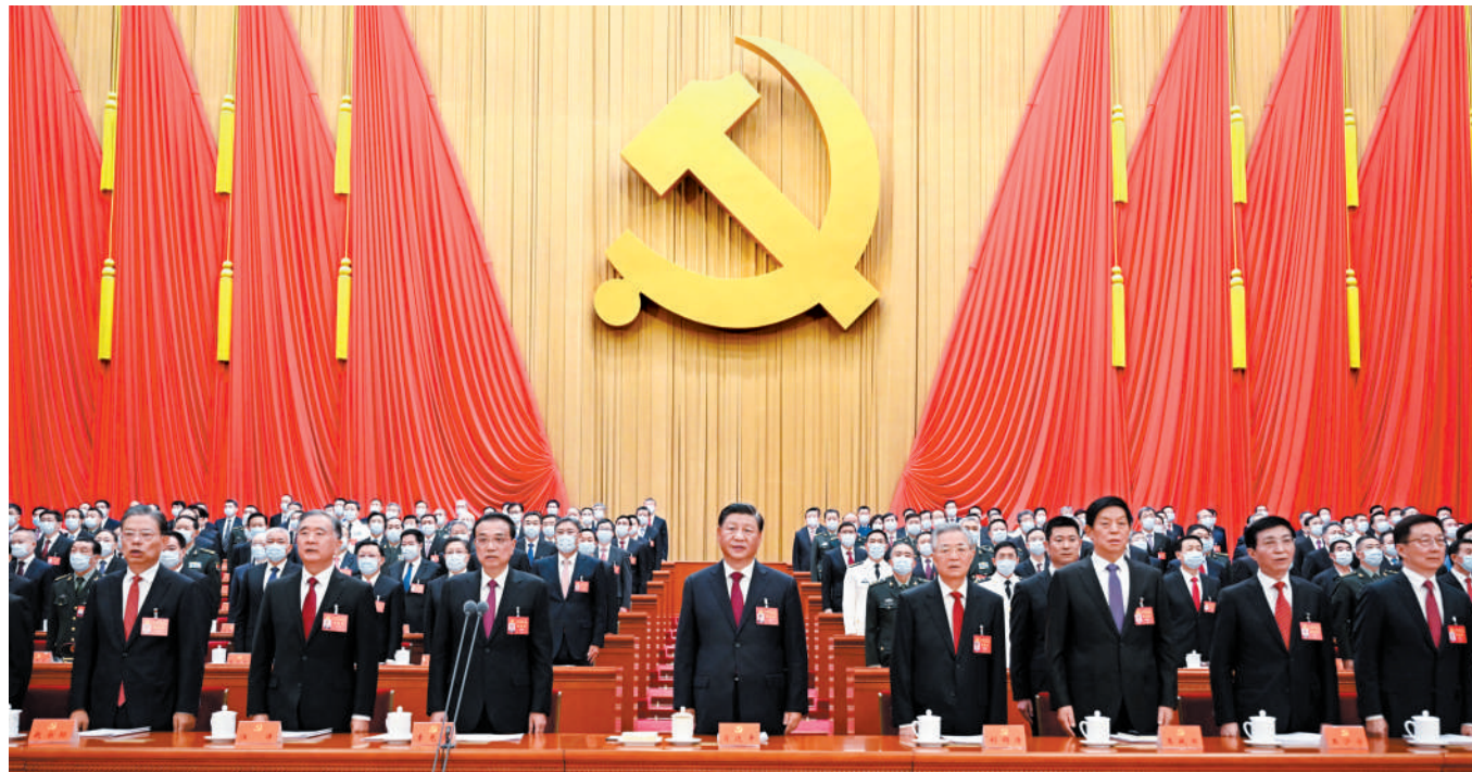
10月16日,中国共产党第二十次全国代表大会在北京人民大会堂开幕。习近平代表第十九届中央委员会向大会作报告。