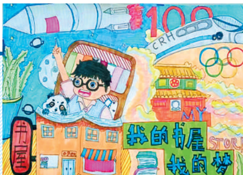
淮海路小学小记者 孟子璇 指导老师:武艳平