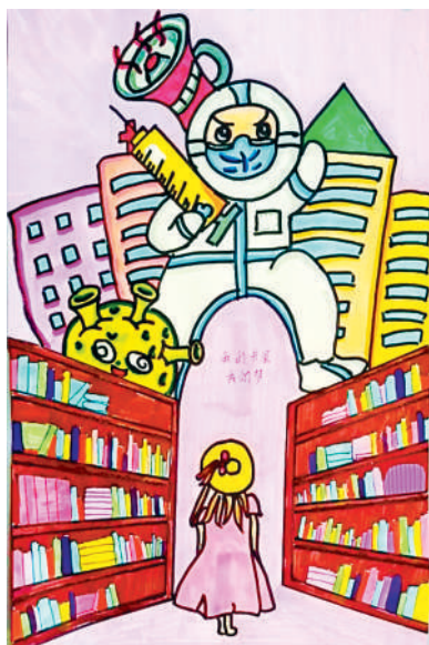
淮海路小学小记者 祁妙 指导老师:乔莉