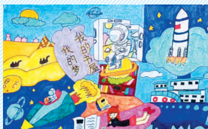
淮海路小学小记者 马艺琳 指导老师:武艳平