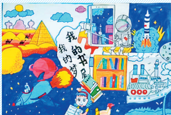
淮海路小学小记者 朱奕诺 指导老师:武艳平