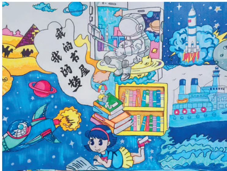
淮海路小学小记者 马晨曦 指导老师:郭魁寿