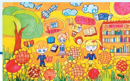
淮海路小学小记者 纵旺彤 指导老师:乔莉