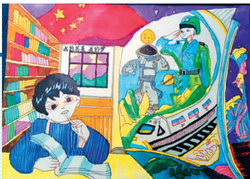
淮海路小学小记者 张武杨 指导老师:乔莉