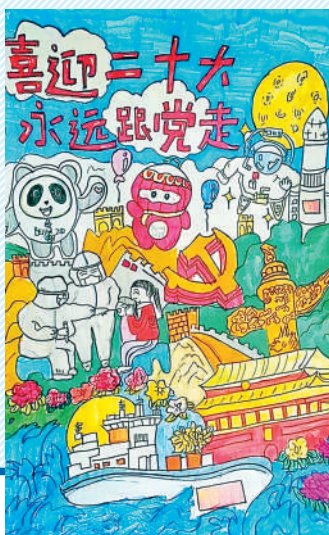
淮海路小学小记者 赵勃竣 指导老师:武艳平