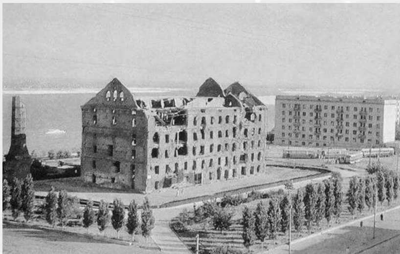
战后巴甫洛夫大楼

学过二战历史的都知道,斯大林格勒战役是二战中苏联和德国战场的重要转折点,也是反法西斯战役即将胜利的标志性事件之一。当时德国在南方集团的司令官是这么说的:“此战让我们损失了四分之一的兵力,相当于打断了我们的脊梁骨”,所以斯大林格勒战役一直占据着非常重要的篇章,不少人前赴后继研究苏联胜利的原因。