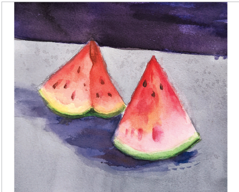
水彩静物 赵雅苒 (13岁) 画