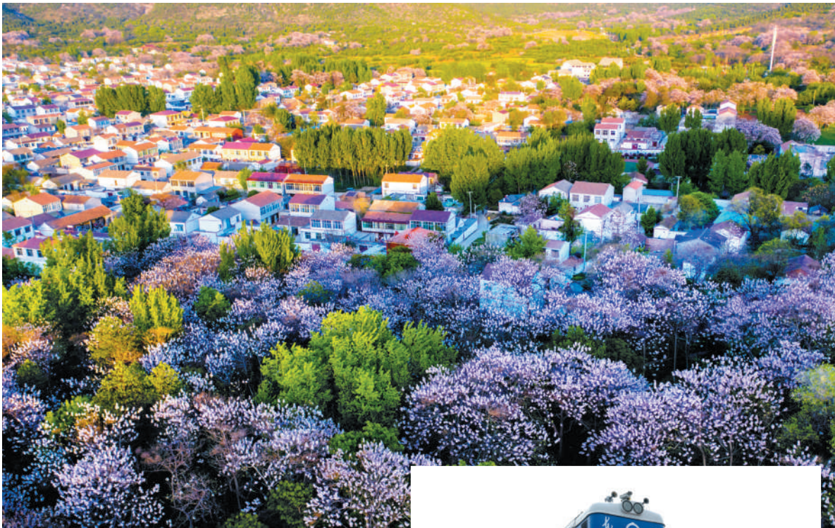
上图:我市倾力打造乡村振兴新美景。

近年来,市委、市政府先后印发多个关于创建全国绿化模范城市的意见及实施方案,成立创建工作领导小组。同步编制完成生态城市建设总体规划、城市绿线规划等多个子规划,有计划地改善城乡生态环境质量。大力弘扬“栽活一棵、不愁一坡”的顽强拼搏精神,采取“三对一”技术服务模式,让全市石质山全部披上了绿装,相山被确立为国家级森林公园。林业技术人员探索出的“七步造林法”,被确定为省地方标准,中央电视台记者专程来淮北市拍摄《石质山造林的功夫秘笈》专题片并向全国推广。