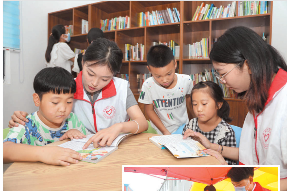
大学生志愿者担当村留守儿童阅读辅导员。

今年暑期，淮溪县四铺镇积极动员返乡大学生参与到各项志愿服务活动中，120余名大学生志愿者主动放弃假期时间，深入基层、走近群众，投身社会实践，弘扬志愿精神，助力家乡发展。在疫情防控、人居环境整治、房屋普查、“双提升”宣传、医保电子凭证激活、发放“监督一点通”手册、防溺水宣传、反诈APP推广注册等方面彰显了青春担当，展现出新时代青年学子的靓丽风采。