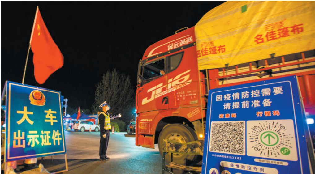
一等奖作品《我为党旗添光彩》。 作者 张红心