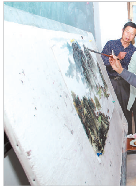
相城老年大学在研究书画。

强化统筹,凝聚办学合力。推动各级各类学校向区域内的老人开放场地、图书馆、设施设备资源,并鼓励各级各类学校为社区、老年教育机构及养老服务机构等提供积极支持服务。发挥社区基层老年协会作用,以季度为周期开展政治、科普、法律等教育活动。民政、卫生、科技等部门构建“1+4+N”智慧养老服务体系,采取“系统+服务+老人+终端+监督”工作模式,建成了省级智慧养老示范项目4个。教育联合科技、科协等部门组织开展老年人智能技术使用培训,通过体验学习、尝试应用、经验交流、互助帮扶等,引导老年人了解新事物、体验新科技。同时依托养老院、敬老院、军休所、福利院嵌入式地举办“老年学习点”“老年学堂”,将老教资源推向基层,办在老年人的“家门口”。市委老干部局积极搭建“银辉助力”舞台,持续开展“银辉添彩”工程,擦亮“银辉讲坛”等系列品牌,鼓励老年人学有所为,在科学普及、环境保护、社会服务、治安维稳等方面服务社会、奉献社会,在实践中实现自我教育、自我提高。