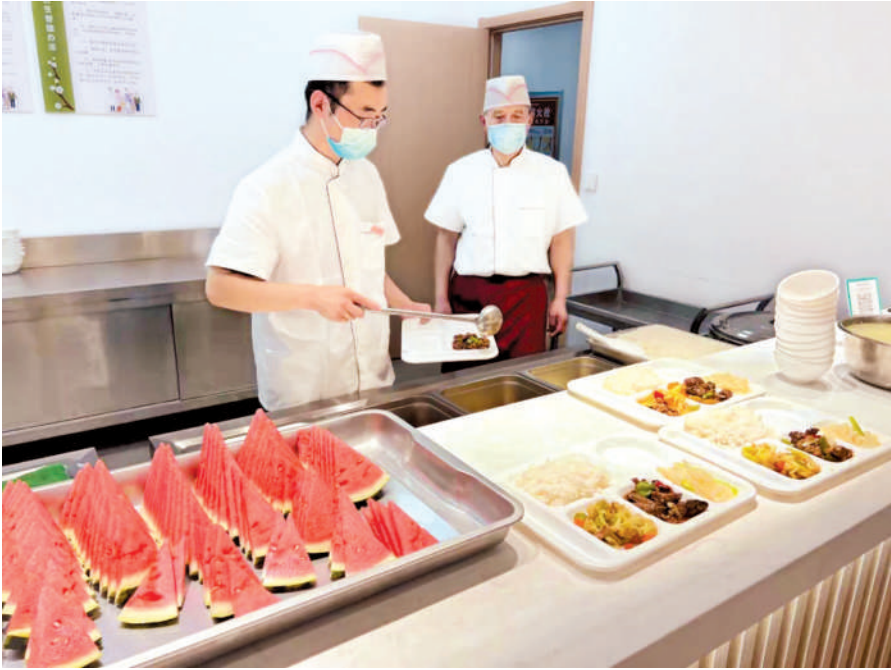
相王现代公司合理搭配饮食。

推进科技项目离不开协同创新。智能化研究所注重发挥青年生力军和突击队作用,支持青年人才“挑大梁、当主角”,同时注重协调配合、科学分工,形成团队整体工作合力,以只争朝夕的精神状态抓推进。坚持每天一反馈、每周一调度,多项模块工作交织进行,加班加点增时速,日追夜赶抢进度。单是