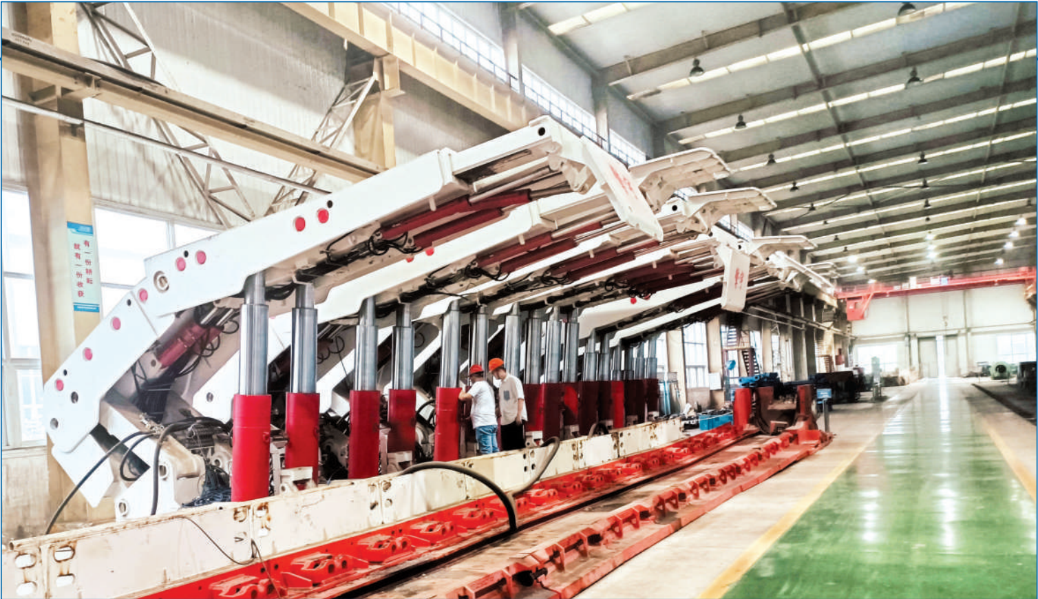
安徽矿机生产车间。