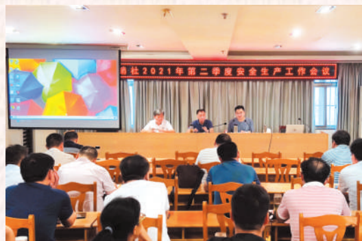
安全生产,常抓不懈。