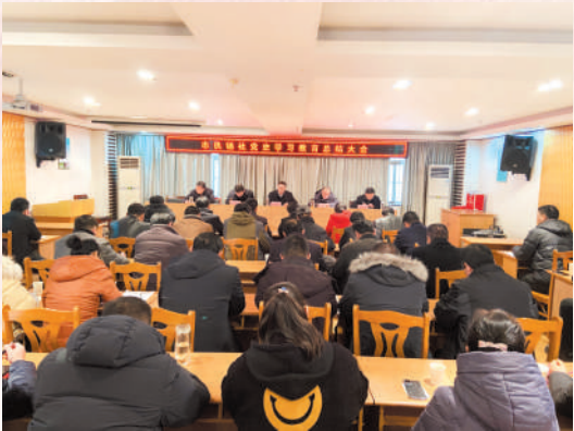
党史学习教育总结大会。