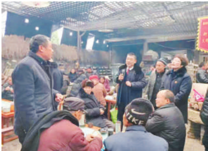
市检察机关工作人员赴临涣镇开展公益诉讼宣传。