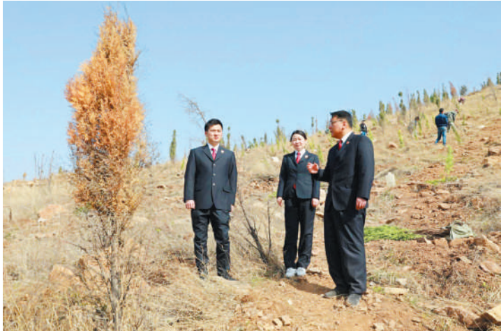
市检察机关工作人员现场监督受损公益林补种。