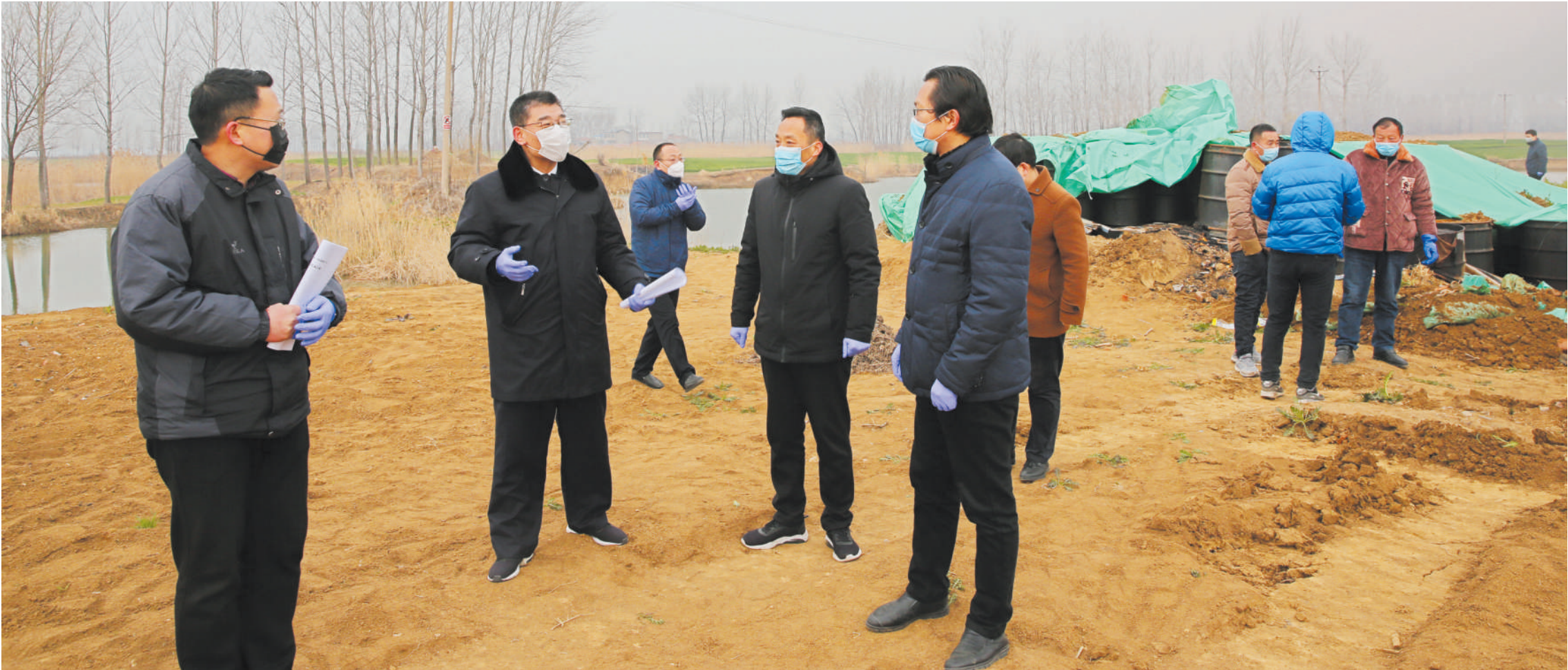
市检察机关工作人员在危险废物清理现场进行监督。