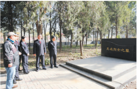
市检察机关工作人员监督修缮濉溪县新庄烈士陵园损毁设施。