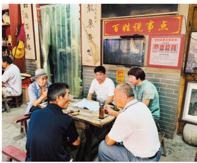
临涣茶馆百姓说事点,说事解纷促和谐。

强化组织保障。市、县(区)、镇(街道)建立由党政分管负责同志为召集人,公安、信访、司法行政等部门为成员的百姓说事点联席会议制度,对百姓说事点工作进行调查研