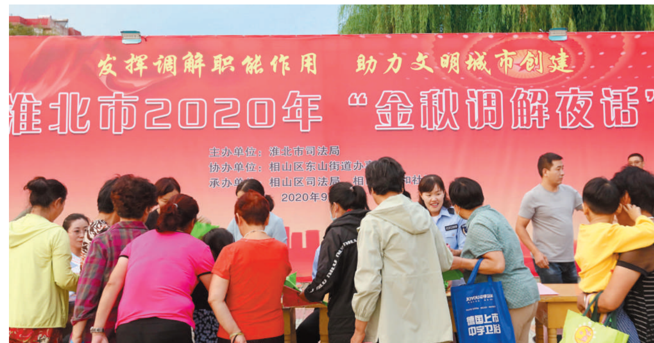
淮北市2020年“金秋调解夜话”活动现场

百姓说事知民意。全力推进“百姓说事点”建设,强化党建引领、创新功能形式、优化地点选择、注重人员选聘,积极收