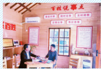
老贾工作室调解员老贾在“说事”。

听百姓之声、排百姓之忧、解百姓之难。近年来,市司法局积极开展“百姓说事点”试点,探索出一条“接地气、共和气、化怨气”的市域社会治理“淮北路径”。2019年12月3日,全省第一个“百姓说事点”在烈山区杨庄社区建立。截至今年4月,全市已建成“百姓说事点”475个,解答咨询37840人次,收集信息18060条,化解纠纷5837件。