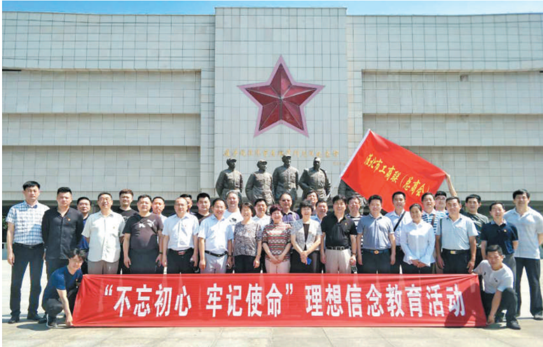
开展理想信念教育活动