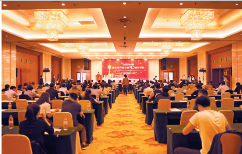
举办民营企业50强发布会