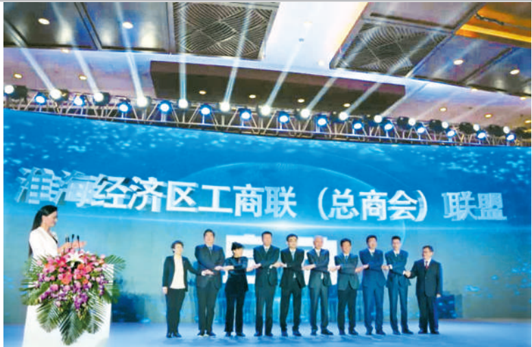
建立淮海区工商联（总商会）联盟