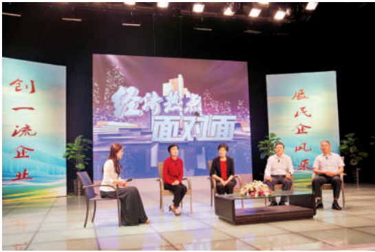
举办“经济热点面对面”访谈活动