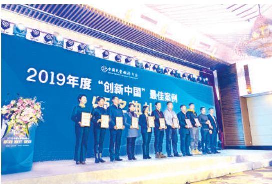
获评全国工商联“创新中国”最佳案例