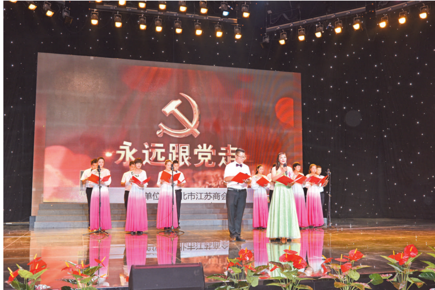
举办党史诵读活动

民营经济人士理想信念教育，以庆祝改革开放40周年、新中国成立70周年、建党100周年等为主题，重点聚焦习近平总书记关于民营经济发展的重要论述、关于新时代民营经济统战工作的重要批示和两次考察安徽重要讲话指示精神，持续开展“大学习、大宣讲、大讨论”，深入开展“诚信守法谋发展、亲清共融促转型”公开签名承诺、“爱国奋斗·青春筑梦”主题演讲、“永远跟党走·奋进新征程”党史诵读、“请党放心、强国有我”主题研讨等形式多样、内容丰富的教育实践活动，教育引导广大民营经济人士团结凝聚在中国共产党的伟大旗帜下，进一步坚定发展信心、勇于创新奋进。