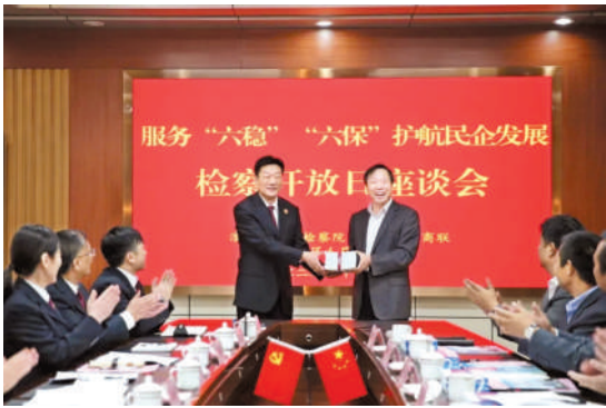
开展护航民企座谈会

打铁还需自身硬。市工商联还深入开展“两学一做”“不忘初心、牢记使命”主题教育活动、党史学习教育，不断强化工商联机关政治建设、能力建设和作风建设，建立健全各项规章制度，推进机关管理更加规范。坚持“内强素质、外树形象”，持续开展“学理论、比先进、查短板、促发展”行动，不断提高“横向协调”“上下联动”能力，机关执行能力和工作效能持续提升，为推动淮北更高质量发展转型贡献工商联智慧和力量。