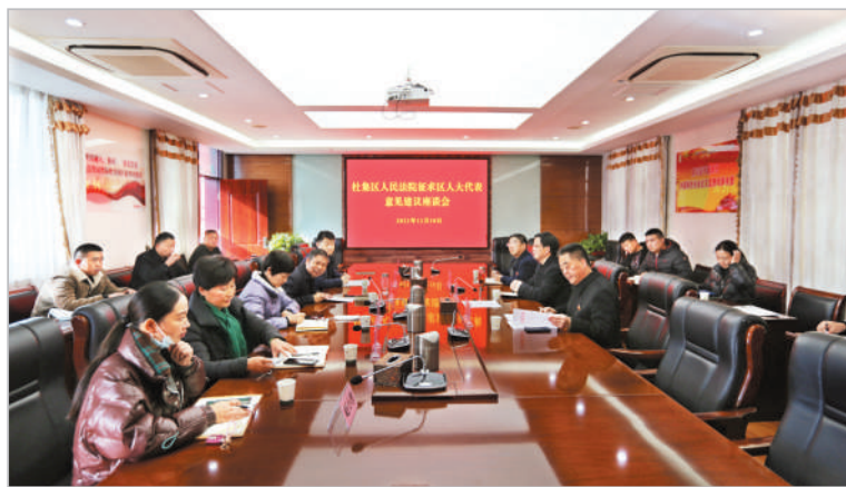
征求意见建议座谈会会场。

自觉接受人大及其常委会监督是人民法院加强和改进工作的不竭动力,是推动新时代人民法院工作实现新发展的重要保障。杜集区法院将进一步加强与人大代表的沟通联络,抓好意见建议的部署落实,不断改进法院工作,为全方位推动高质量发展提供更加优质高效的司法保障。