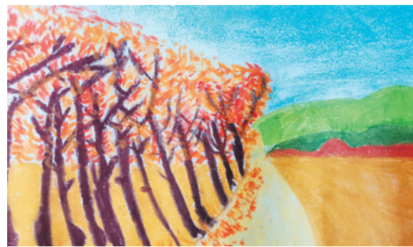
淮海路小学小记者 代馨瑜 指导老师:解春荣