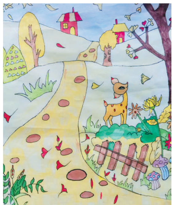
淮海路小学小记者 张婧秋 指导老师:郜业玲