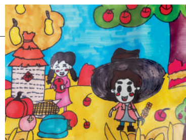
淮海路小学小记者 张炜婷 指导老师:郭魁寿