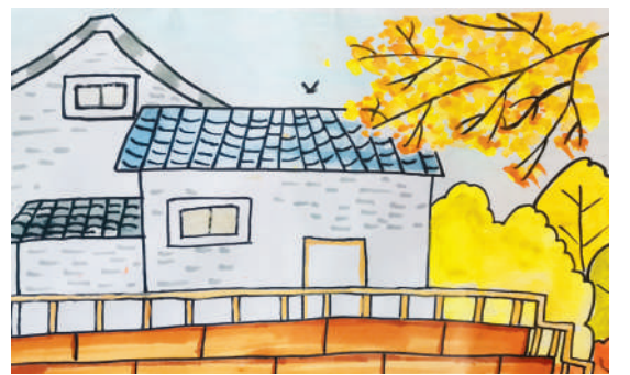
淮海路小学小记者 刘宇琪 指导老师:朱艳