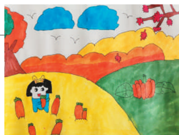
淮海路小学小记者 张心怡 指导老师:丁惠平