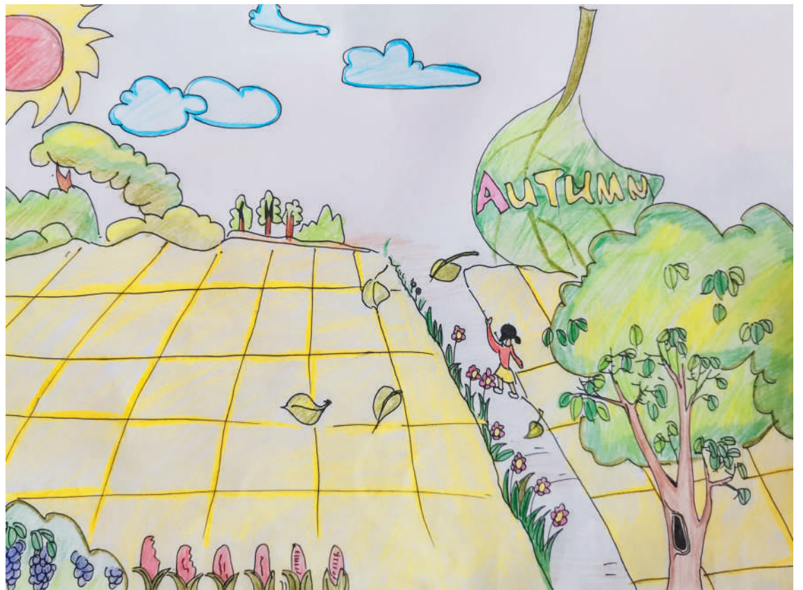
淮海路小学小记者 李梦然 指导老师:郜业玲