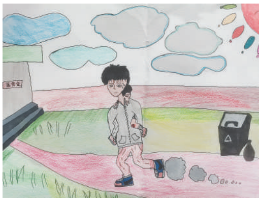
淮海路小学小记者 张宇陈 指导老师:徐华