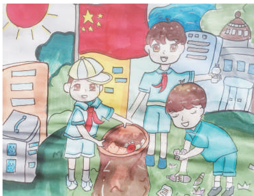
淮海路小学小记者 向启畅 指导老师:丁惠平