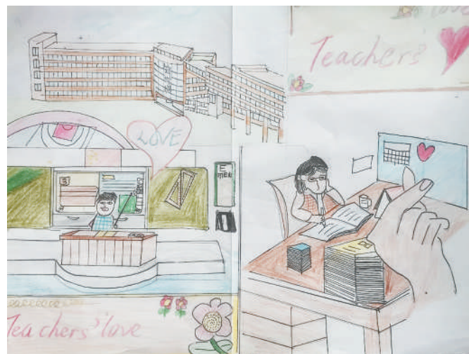
淮海路小学小记者 李梦然 指导老师:郜业玲