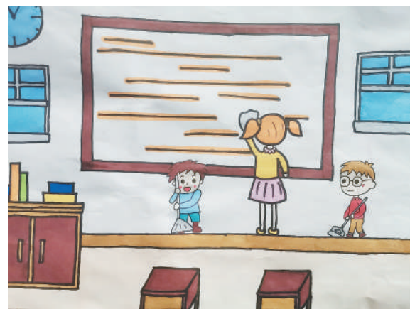
淮海路小学小记者 张馨予 指导老师:徐华