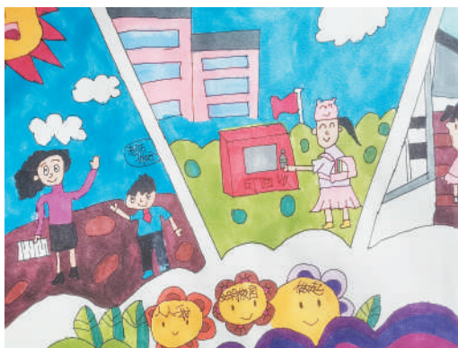
淮海路小学小记者 张心怡 指导老师:徐华