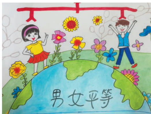
淮海路小学小记者 张武宸 指导老师:朱彩梅