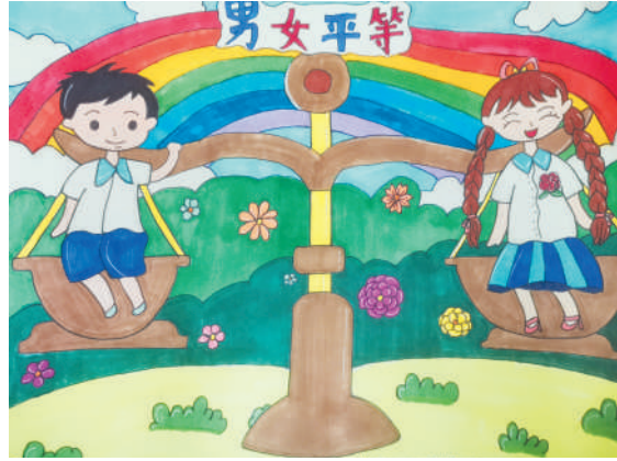
淮海路小学小记者 高睿泽 指导老师:陈永胜