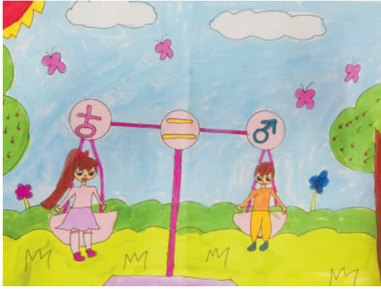
淮海路小学小记者 李匀卉 指导老师:朱彩梅