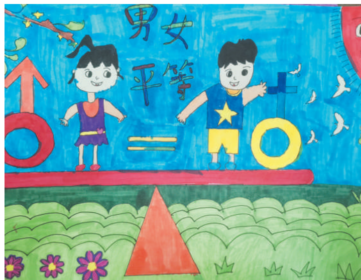
淮海路小学小记者 张武杨 指导老师:乔莉