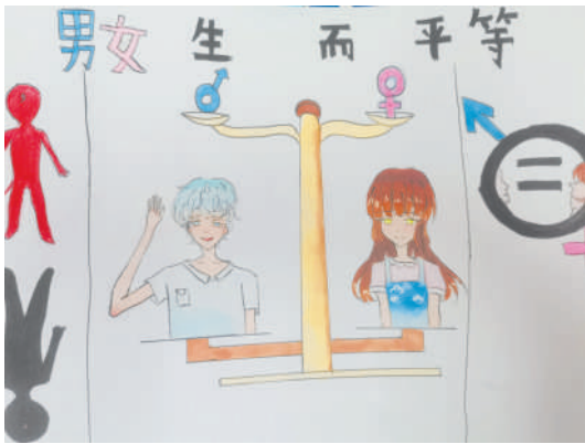
淮海路小学小记者 汤涵雯 指导老师:丁惠平