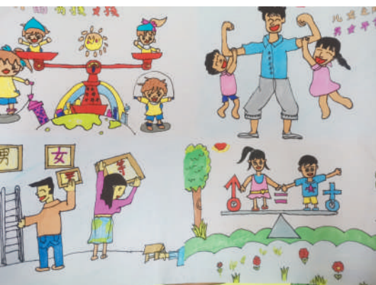
淮海路小学小记者 张婧秋 指导老师:郜业玲