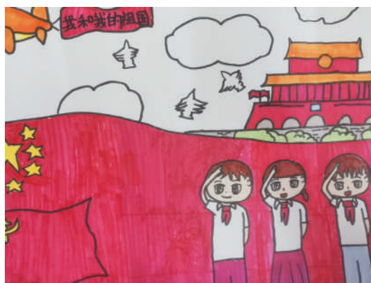
淮海路小学小记者 刘思雨 指导老师:丁惠萍