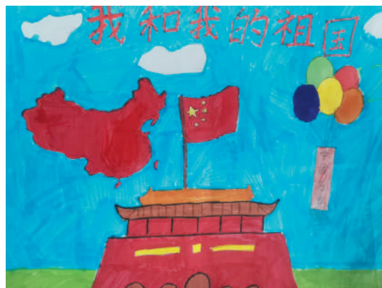
淮海路小学小记者 郭旭峰 指导老师:李玉