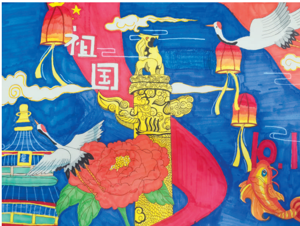
淮海路小学小记者 刘惠慈 指导老师:朱艳