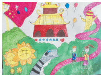
淮海路小学小记者 张宇陈 指导老师:丁惠萍