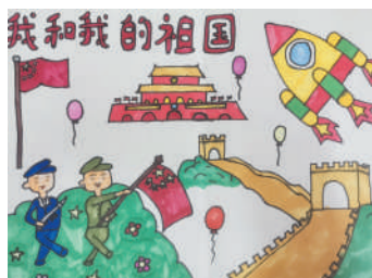
淮海路小学小记者 杨亚楠 指导老师:朱艳