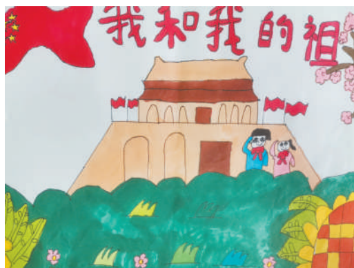
淮海路小学小记者 张心怡 指导老师:丁惠萍