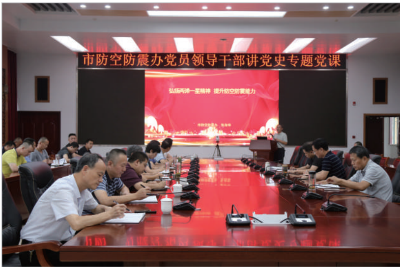
扎实开展党史学习教育,筑牢初心使命