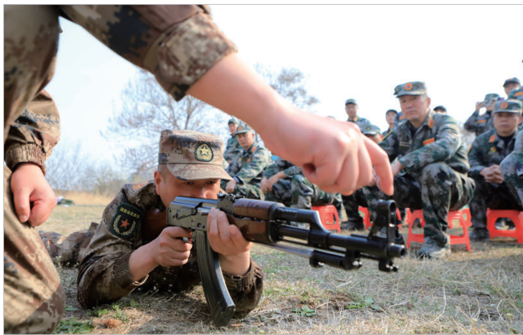
步枪100米射击训练,掌握射击要领

展开历史画卷,书写精彩华章。淮北市防空防震办在市委、市政府的正确领导下,始终坚持以习近平总书记关于人民防空系列重要讲话精神为指导,以军事斗争应急准备为牵引,围绕有效履行“战时防空、平时服务、应急支援”的使命任务,深化解放思想,聚焦能力建设,聚力对标补短,服务全市大局,我市人民防空事业在探索中成长进步,在奋斗中日益壮大。