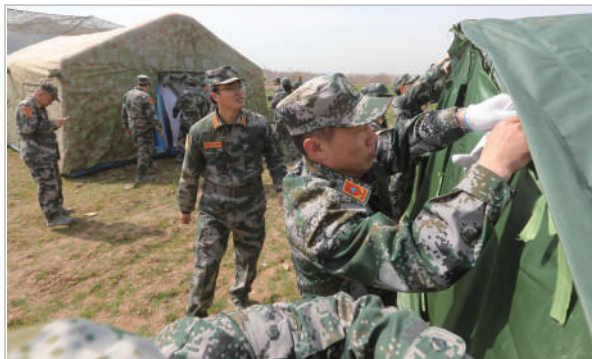
机动指挥所搭建、地震流动台架设