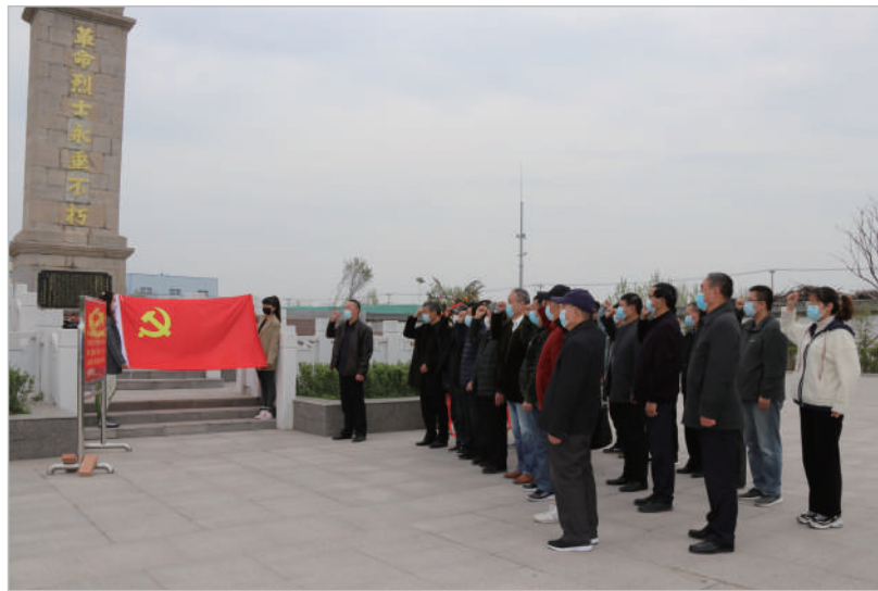
重温革命历史,培养革命情怀,传承红色基因