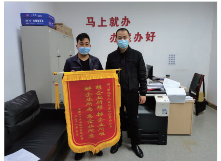
主动服务,审批提速,赢得企业赞誉