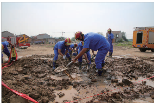
人防专业队伍关键时刻显身手