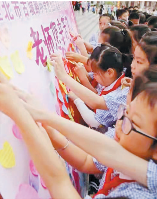
古城路小学学生们写下祝福的话语，感恩师恩。