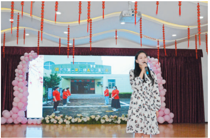
市第二实验幼儿园举办“奋斗正青春 青春献幼教”演讲比赛。

近年来，相山区始终把教育摆在优先发展的战略地位，以办好人民满意的教育为目标，持续加大教育投入，大力实施招生制度改革、人事制度改革、办学体制改革、教育评价体系改革等创新举措，持续推动相山教育从基本均衡走向优质均衡。为大力宣扬优秀教师的先进事迹，表达对教育工作者的充分肯定与鼓励，全区100名教师获评“优秀教师”“优秀骨干”“优秀班主任”称号。