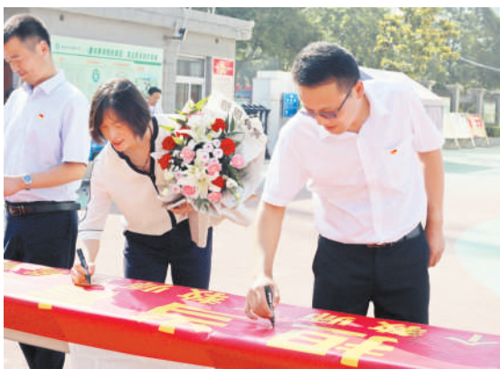
翠峰小学教师在条幅上签名。