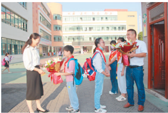
翠峰小学少先队员为老师献上鲜花表达祝福。