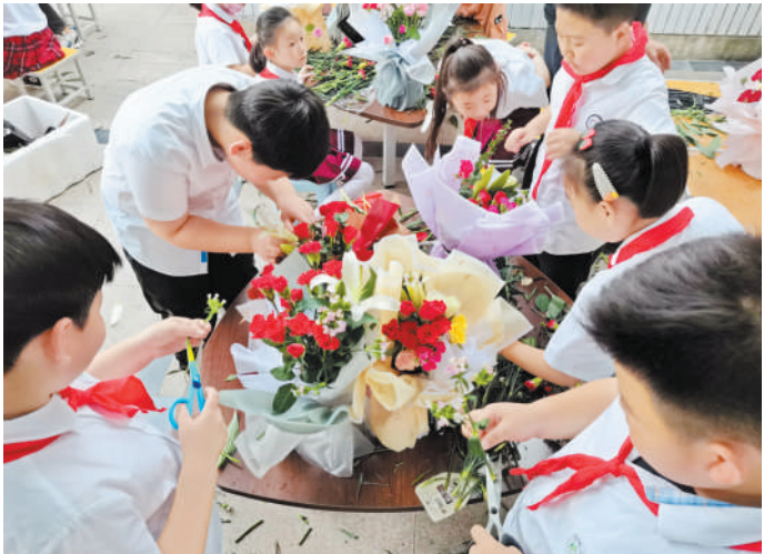
市第二实验小学举办“手办花束念师恩”联谊活动。

谢意。希望广大教师和教育工作者既要善于“传道、授业、解惑”，更要善于“言传、身教”，带头树立高尚的道德情操和精神追求，用自己丰富的学识，不断书写教书育人的新篇章。