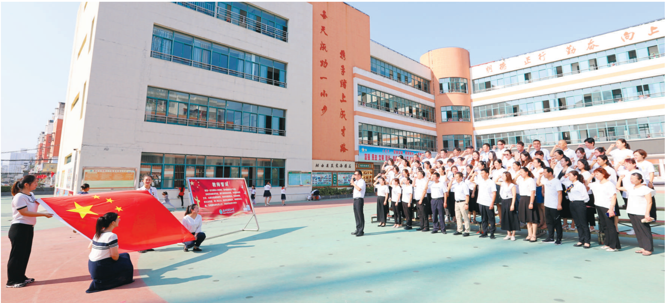
翠峰小学教师集体宣誓。