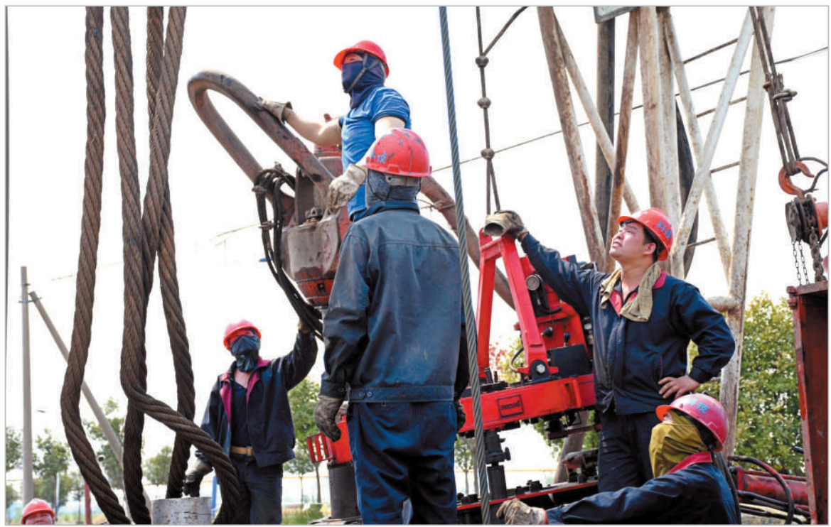
大口径分公司袁一802钻机瓦斯抽采井项目施工现场

头整理淮北矿区地质档案，继续收集相关资料数据，按资料划分标准分类整理，建立公司地质资料数据库。全面深入推进党的建设。充分发挥公司党委“把方向、管大局、保落实”的领导作用，为公司高质量发展提供坚强政治保障。把学习贯彻习近平总书记“七一”重要讲话精神，作为当前和今后一个时期的一项重要政治任务。深入贯彻落实《关于加强领导班子建设的实施办法》《关于加强班子团结提高凝聚力和战斗力的六条规定》，确保集团和公司部署的重点工作有突破、有进展、有成效。全面从严从实推进“学党史、抓整改、正作风”工作，广泛开展建党100周年宣传活动，把学习教育开展得有声势、有特色、有成效。实施“党建+”融合工程，把党建的政治优势、制度优势、人才优势、组织优势转化为经营优势、效率优势，把生产经营中的难点，作为党建工作的重点来抓，以党建促发展。