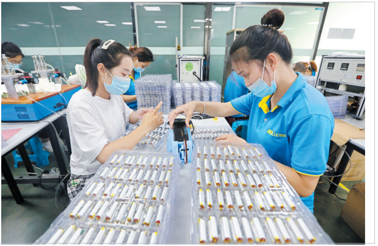
烈山区基层党史专题宣讲报告会走进企业一线

8月9日,淮北市锂电芯新能源科技有限公司生产车间内,工人们正在加工生产锂电池。近年来,烈山经济开发区大力发展以锂离子电池设计研发、生产、销售为一体的高新技术锂电池新能源产业,锂电池具有使用安全、能效比高、环保无污染的特性,市场前景广阔。