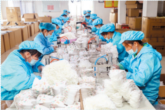
双堆集镇淮北大益防护用品有限公司淮北产“口罩”畅销国外。