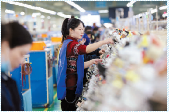
安徽京信电子有限公司产销两旺。