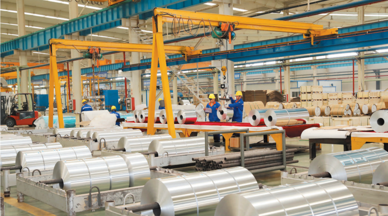
安徽弘邦天力铝箔股份有限公司生产车间。

帮助有办法。完善市、县(区)领导干部联系民营企业常态化机制,每半年至少到联系服务的企业调研1次,政企交往做到“亲”而有度、“清”而有为。积极帮助企业开展信用修复,并在“信用淮北”网站同步更新结果。市财政列支100万元专项用于企业家到长三角等发达地区开展体悟实训,帮助企业提升能力素质。建立党建指导员、政策解读员、诉求传递员、企业服务员等“四员合一”制度,精准帮助企业纾困解难、健康成长。