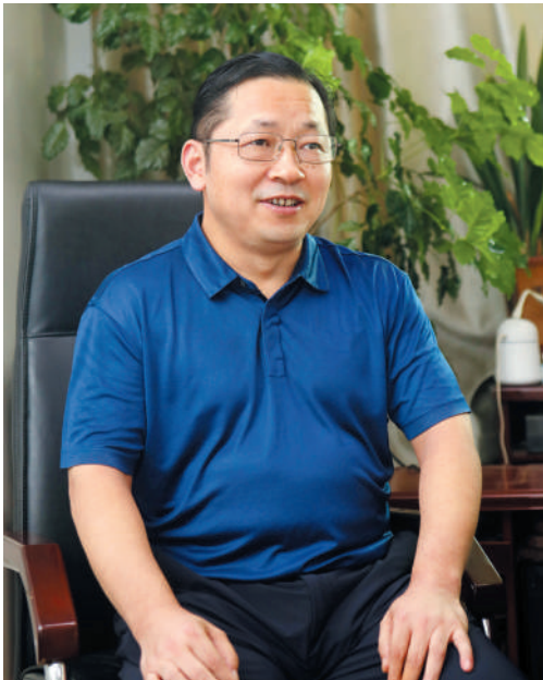
陈言超 ■摄影 记者 冯树凤