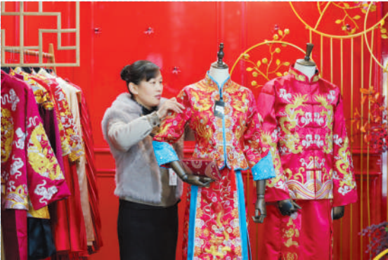
濉溪镇淮海壹号返乡创业园“小花褂”走向世界市场。