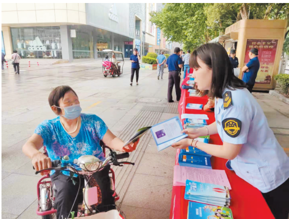
参加区应急局组织的安全生产月宣传活动