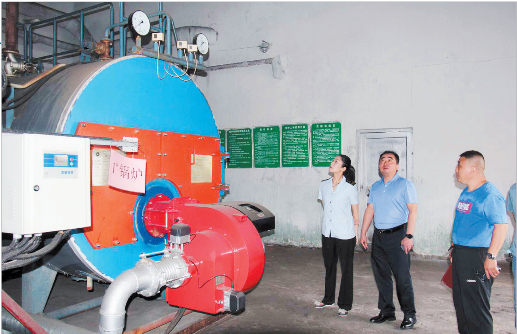
检查企业特种设备安全管理情况