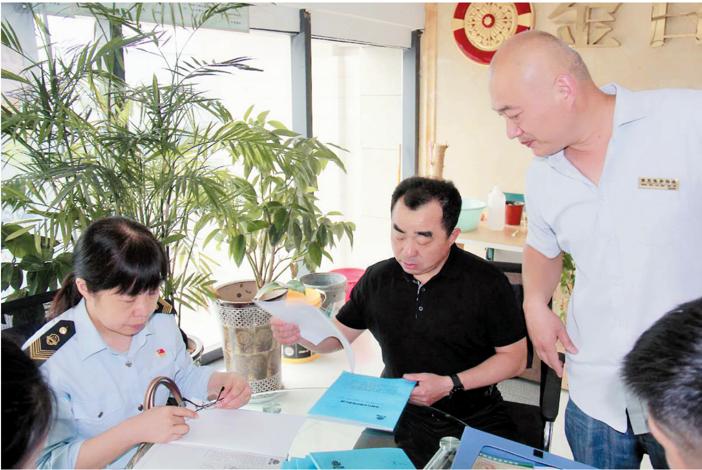
检查特种设备使用单位金百合小区

通过开展特种设备“安全生产月”活动，进一步提高了广大人民群众共同参与特种设备工作的积极性。下一步，区市场监管局将继续保持高标准严要求，认真总结经验，坚持问题导向，扎实开展特种设备安全监察工作，竭力为人民群众营造良好的安全生产环境，不断增强人民群众获得感、幸福感、安全感。