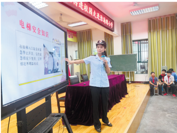
特种设备安全知识宣传走进淮海路小学