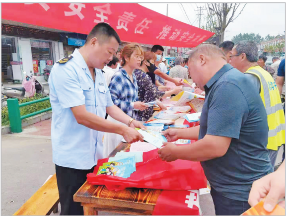
在土楼街开展特种设备知识宣传