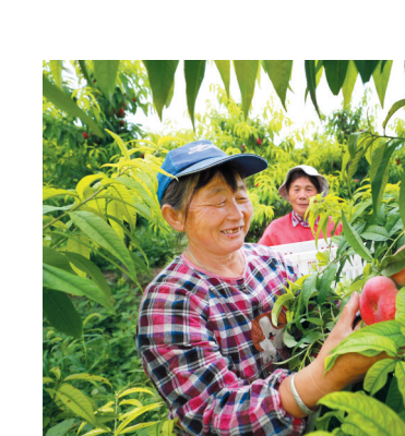
古饶供销社改造提升为民服务。

坚持合作经济属性,通过引荐、走出去等方式,联系洽谈一批客商,在招商引资方面不断取得新突破。深圳市双亚科技有限公司投资1亿元建设的联旭高倍率电池项目已落地投产;裕丰农产品加工及冷链物流项目投资1.2亿元、天润低风速风力发电项目总投资2.8亿元、淮北市冷链物流项目投资3.6亿元,库容4000吨,均在招商平台备案。