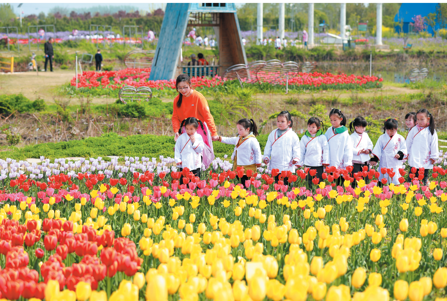
双楼花海醉游人。

加快发展合作经济,通过实施开放办社、合作兴社,综合运用提升、改造、新建等多种手段,提升为农服务水平。社有资产公司粮库获