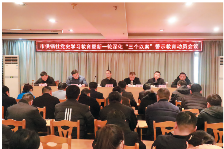
市供销社党史学习教育暨新一轮深化“三个以案”警示教育动员会会场。

淮北市供销社始建于1961年,是由市政府管理的全市供销合作社的联合组织。市供销社机关是财政拨款的参公事业单位,主要职责:宣传贯彻党和国家有关农村经济工作和社会发展的方针、政策,研究制定供销合作经济的发展战略和发展规划,指导全市供销合作社经济的发展;为“三农”提供服务,成为政府与农民密切联系的桥梁和纽带,促进全市供销合作经济的发展;承担国家和地方政府委托的任务,对重要农业生产资料、棉花、废旧物资及烟花爆竹等商品物资的经营进行组织、协调和管理;推动和参与有关法律、法规和政策的制定,促进供销合作经济的发展;向各级党政机关和有关部门反映农民社员和供销合作社的意见、要求,维护其合法权益;指导全市供销合作社的组织建设,协调各级供销社的关系,发挥群体优势。