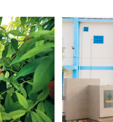
市国有资产经营管理有限公司粮食仓库。

市供销社支持鼓励社属企业、基层社在乡镇建设综合服务社(站),搭建生产、流通、培训、信息等综合服务平台,共创建三星级服务