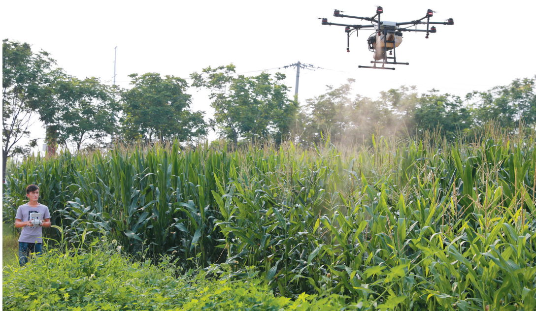
田间无人机飞防助丰收。

得中央预算内资金补助264万元,现已竣工验收完毕,年收益达130余万元;古饶供销社投资近百万元对长期闲置的老旧综合楼进行改造,建成855平方米的农资服务中心;濉溪县百善为农服务中心项目用地10亩,建筑面积约2000平方米,已于2020年底前完成。此外,渠沟供销社省级农民创业园示范园改造提升项目正在推进中;杜集区高岳镇为农服务中心建设工程全面启动;金信农资公司引资建设项目完成签约,计划投资5000万元。