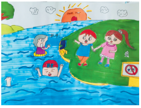
淮海路小学小记者 朱柯润 指导老师:朱彩梅