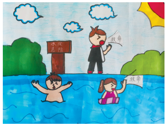
淮海路小学小记者 祁妙 指导老师:乔莉