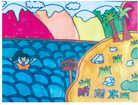
淮海路小学小记者 蒋雨辰 指导老师:张青