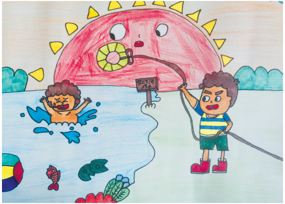
淮海路小学小记者 黄诗彤 指导老师:张青