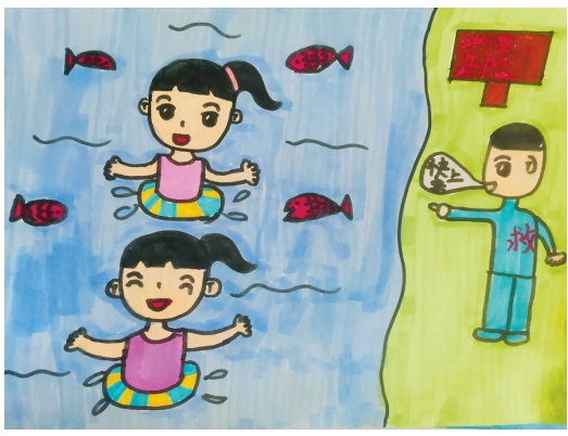
淮海路小学小记者 刘思雨 指导老师:徐华