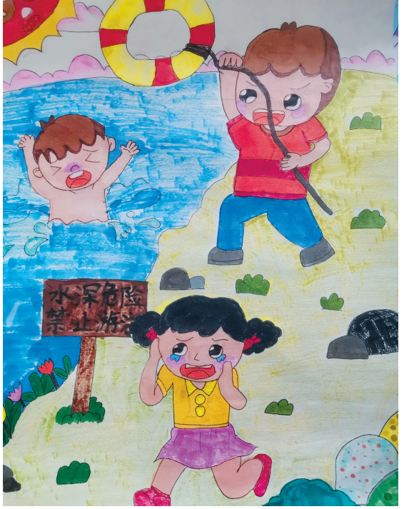
淮海路小学小记者 罗雅馨 指导老师:朱彩梅