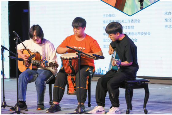
参赛选手倾情演绎