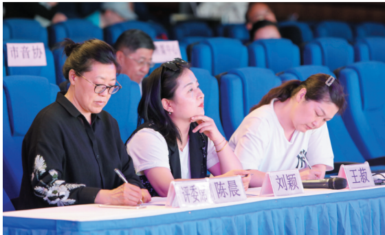
评委认真聆听选手演唱