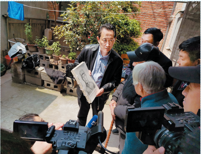
张传贤老人看到画像。