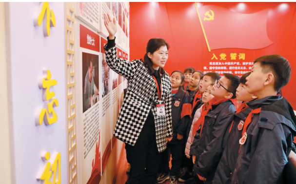
讲党史故事，传承红色基因。