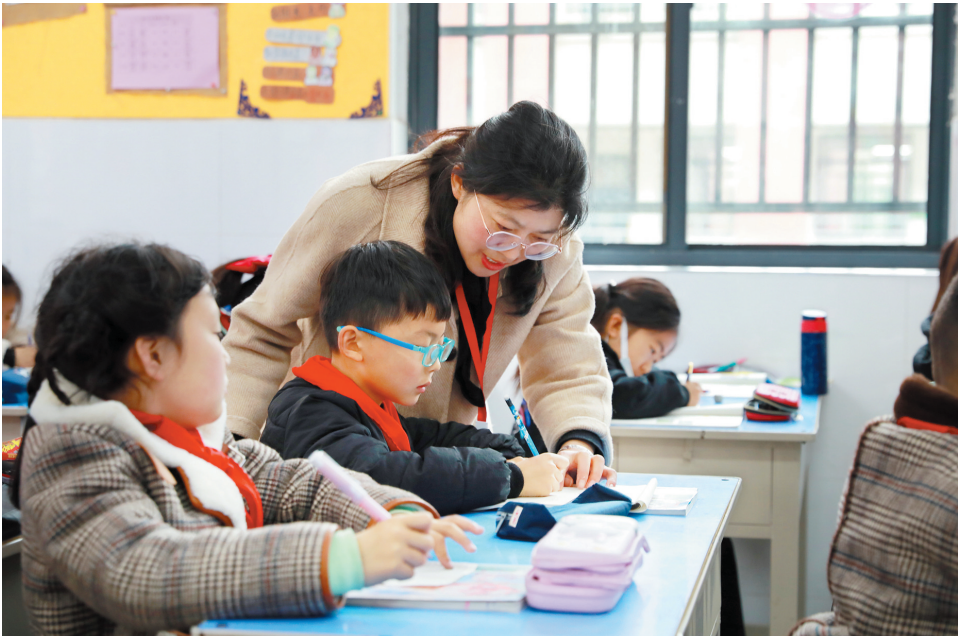
对孩子进行辅导解答。