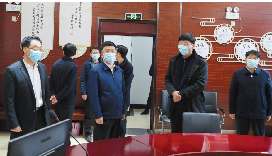
董开军(前左二)在烈山法院调研指导工作。

推动审判执行质效稳步提升,不断提高群众安全感、满意度。要加强多元化解解工作,深入推进诉源治理。弘扬新时代“枫桥经验”,紧紧依靠基层党委政府,强化一站式多元解纷机制建设,在服务乡村振兴、化解基层矛盾、参加基层治理等方面取得新成效,确保社会和谐稳定。要探索增设少年法庭,积极创新审判改革。高度重视未成年人权益保护,对家事审判中涉未成年人的案件创新思路,加强研究,推进未成年人审判工作各项改革,走出具有烈山特色的少年审判之路。要打造特色法庭品牌,助推法院工作发展。利用家事审判法庭现有优势,提炼法庭特色亮点,打造法庭特色品牌项目,努力建设出人民更加满意的法庭,进