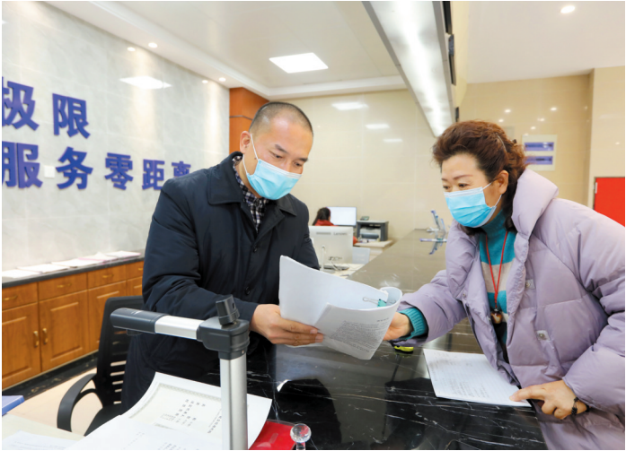
濉溪县政务服务副中心提供高效便捷政务服务。

全力以赴帮助企业解决用工难题是该中心优化营商环境的一个缩影。今年以来，位于濉溪经济开发区的县政务服务副中心以服务企业、打造投资软环境为主线，不断优化行政审批流程，提升行政审批效率，为招商引资企业推出特色服务，全力提升便民高效政务服务环境。 自去年运行以来，该中心以“便民、公开、廉洁、高效”为服务