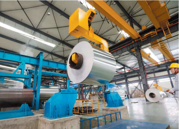
安徽力幕新材料科技有限公司二期项目生产车间。

濉溪经济开发区转型升级提标换挡，成功入选长三角一体化省级合作园区和皖北承接产业转移集聚区，转型发展进入快车道。搭建研发平台，鼓励企业自助创新，组建省级工程(技术)研发中心11家，成立皖北铝基材料产业研究院，全力推动铝制品质量监督检验中心升级“国字号”。强化政策资金扶持，铝产业基金募集资金规模已达6.283亿元，申报新增中央投资项目15个、总投资81.63亿元。深化体制机制改革，形成人员能上能下、能进能出的用人机制。推进公共服务配套，依托10万平方米的工业孵化综合体建设电子商务公共服务平台。