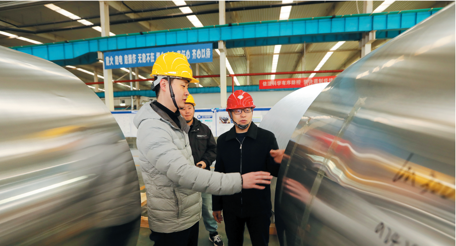
濉溪经济开发区经济发展部工作人员走进力幕科技了解企业生产经营情况。

濉溪经济开发区认真贯彻落实上级决策部署，围绕提升服务效能，优化营商环境，创新思路、创新办法，努力促进项目服务建设再上新台阶。提升服务项目效能，推行企业投资项目承诺制，成立企业服务中心，全力提升服务环境，对园区内新入驻企业推行服务承诺制，全程代办，限时办结。在办理前期证件中，推行“容缺”机制，编制“最多跑一次”事项清单，推进互联网+政务服务，提升办事效率。继续深入开展“抓整改、提效能、促发展”专项行动，持续改进工作作风，以高效服务激发经济发展活力。做好征地报批工作，优先确保哈东盛、中德产业园等重大项目的用地，加快“腾笼换鸟”，加大僵尸企业处置力度，盘活低效闲置土地。建立僵尸企业项目库，实施一企一档、一企一策，联合法院、税务、财政等部门成立工作组进行僵尸企业收储。濉溪经济开发区盘活闲置低效土地366亩，创新招商选资方式，推动与俄罗斯铝业公司对接解决铝原料源头问题，全力推进总投资5亿元的哈东盛集团高端铝基新材料等一批体量大、带动性强、前景好的项目签约落地。谋划并实施年产200万吨新型轻合金项目，推进总投资约100亿元高标准配套基础设施建设。重点抓好中德产业园、理士新能源、鸿源煤化工技改、美信二期、力幕科技二期等18个新续建项目的建设。同时，促使美信二期、力幕二期、雄创铝业等项目早投产、早达效。