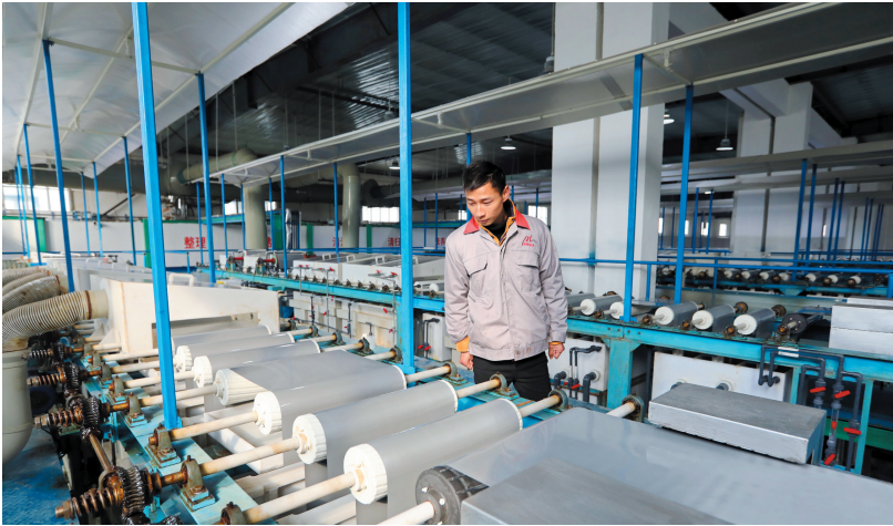
安徽亚明铝业科技有限公司生产设备运行正常。

自企业落户濉溪以来，濉溪经济开发区在项目立项、环评审批、奖项申报等各项手续办理上，均派有包保人员与企业对接，帮助企业办理各项申报手续。在今年省发改委实施的“三重一创”建设项目申报中，濉溪经济开发区组织