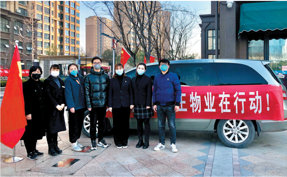
青年突击队在行动。

用，加强党建品牌的影响力，切实用品牌建设的理念、方法和机制加快推动党建工作提质、增效、升级，进一步引领公司生产经营工作高质量发展，根据淮海实业集团党委“三个一”党建品牌创建要求，相王物业党支部立足高质量、高标准开展现代服务工作的实际决定，坚持党建“融入中心、融入管理”，开展党建品牌创建活动，充分发挥基层党组织的政治核心作用，全面打造相王物业“红色党建”品牌。