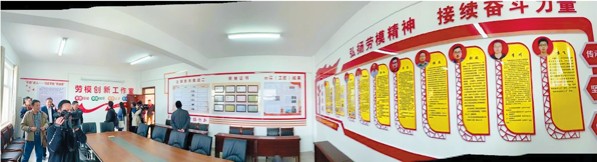
中勘科技公司劳模创新工作室。

采访团实地走访了中勘科技公司、新宇公司生产现场，开展了“一把手面对面”采访活动，并分别围绕中勘科技和新宇公司的技术创新、市场开拓、环保生产、精细化管理、企业党建、安全生产、劳模工作室等内容进行了交流访谈，深入挖掘企业在改革发展进程中的经验做法，了解企业发展方向和发展规划等。