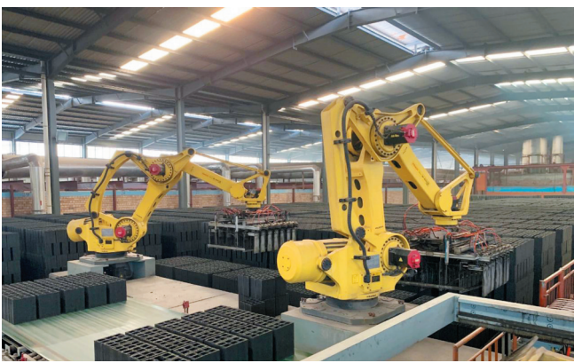
新宇公司自动化新型环保砖生产线。